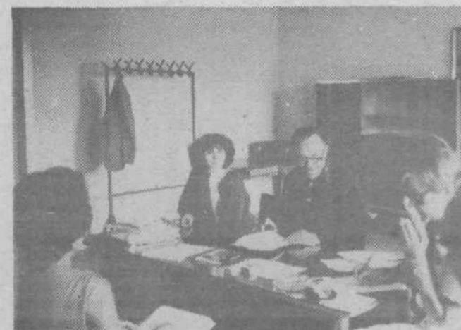
Z ustanovne skupščine drsalno — kotalkarskega kluba Stanka Bloudka