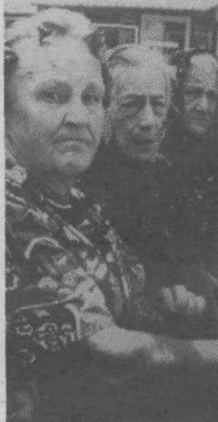
V delu je mladost: priznanja za najstarejše