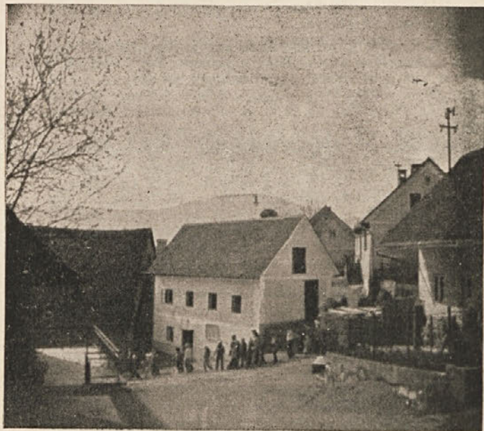
Cankarjeva rojstna hiša. Prave hiše ni več, ker je 1879 pogorela. V novi hiši Cankarjevi niso več stanovali. Danes je v tej hiši kulturni spomenik v čast Cankarju.

Kdor ljubi svojo domovino, je z enim samim objemom svoje misli obseže vso; ne samo nje, temveč vse, kar je kdaj ljubil in kar bo ljubil kdaj pozneje. Zakaj ljubezen je ena sama in nerazdružljiva; v en sam kratek utrip srca je stisnjeno vse – mati, domovina, Bog.