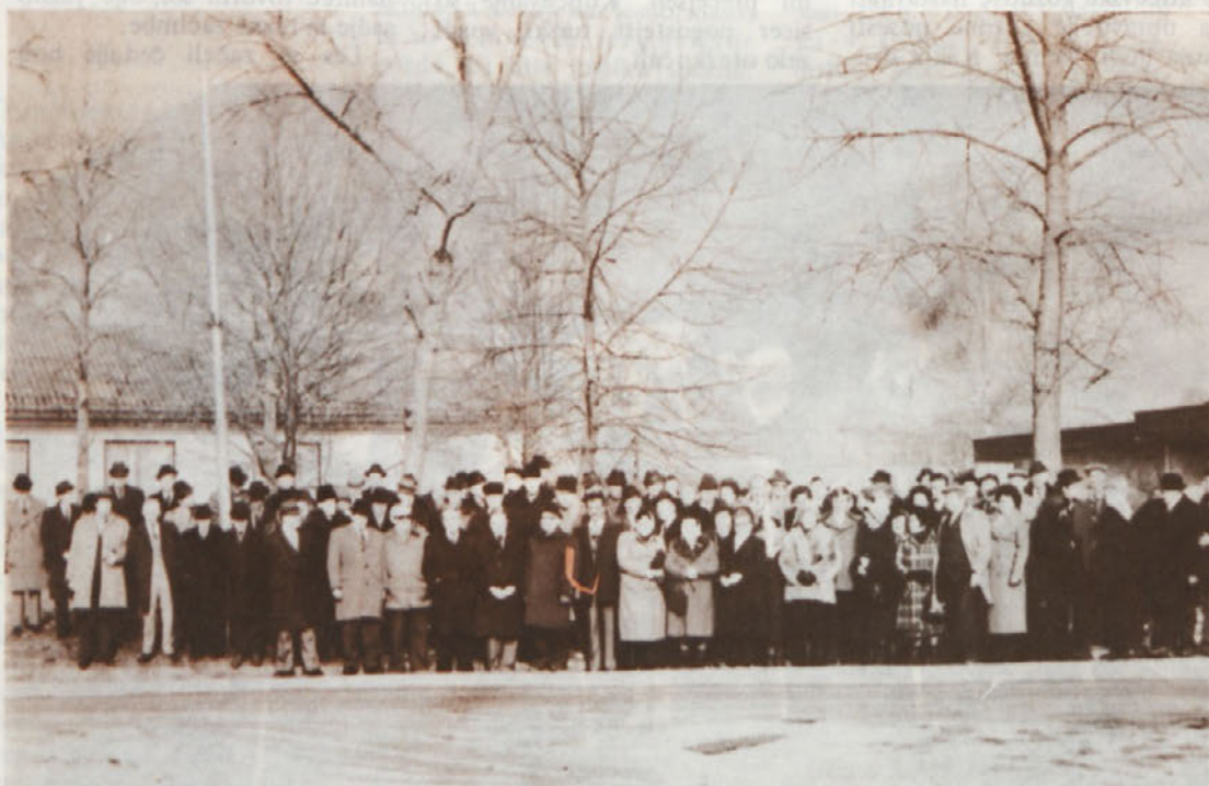
V petek, 15. januarja, so se v Novolesu na tradicionalnem srečanju sešli naši upokojeanci. Po krajšem sestanku v jedilnici so si ogledali proizvodnjo v straških tozdih, nato pa so odšli na kosilo v Dolenjske Toplice. — Na tem mestu naj zapišemo, da smo prejeli številne pismene zahvale za organizacijo srečanja, za katere se vsem najlepše zahvaljujemo.

Glasilo „NOVOLES“ ureja uredniški odbor. Odgovorni in tehnični urednik Vanja Kastelic. Izdaja delovna organizacija „NOVOLES“, lesni kombinat Novo mesto – Straža. Naklada 3200 izvodov. Stavak, filmi in montaža: DITC, TOZD Dolenjski list. Tisk: DITC, TOZD Tiskarna Knjigotisk. Glasilo je oproščeno temeljnega prometnega davka na podlagi menja Sekretariata za informacije pri IS SR Slovenije št. 421/72 z dne 31. januarja 1978.