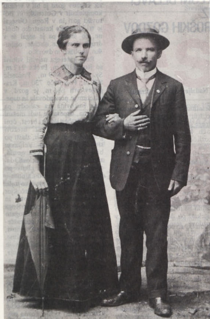
I. Zoran z ženo (fotografiran okoli leta 1912). Bil je prvi sindikalist v Soteski. Imel je več poklicev. Bil je: oglar, tesar, gozdni delavec, fratar in žagar.

Že v 16. stoletju se omenja živahen promet lesnih izdelkov, ki so jih podložniki iz kočevskega in okoliških krajev tovorili do morja. Izvozni promet je bil precejšen. Kupčevanje so sicer pogostejši turški vpadi zelo otežkočali.