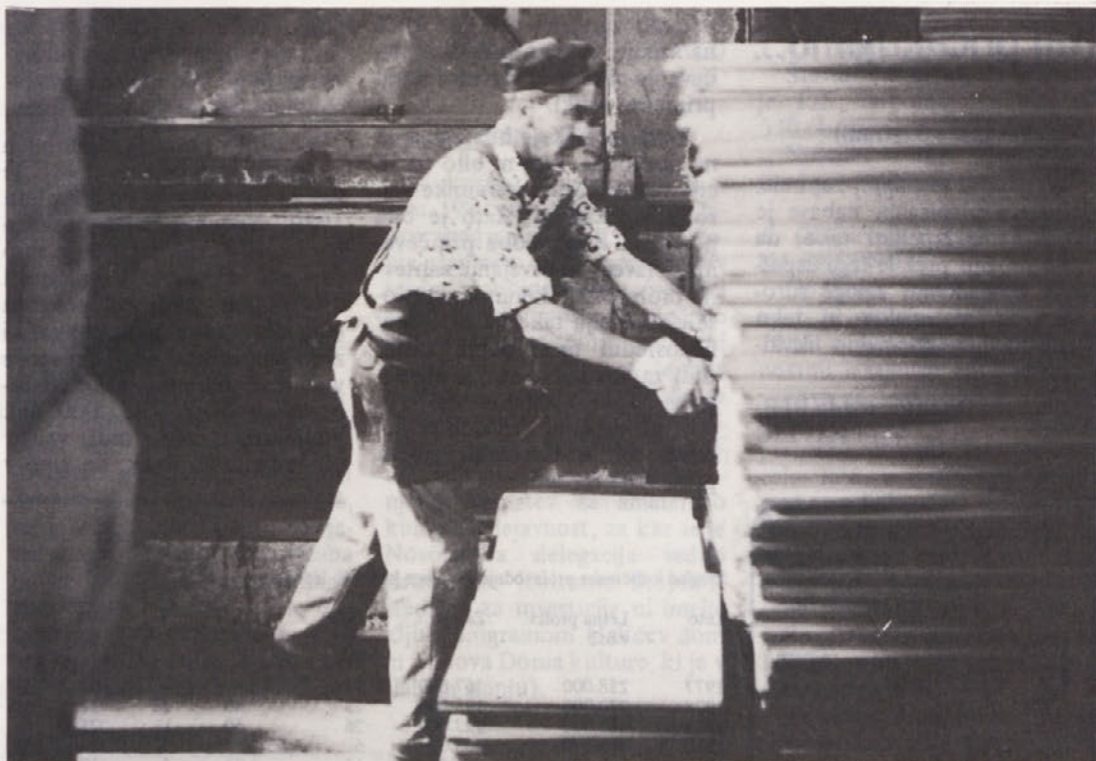
Motiv iz proizvodnje v TOZD TVP

V letu 1981 je stopil v veljavo nov zakon o sistemu cen. Več kot pol leta je trajalo, da je zakon pričel delovati v okviru samoupravnih institucij. Žal pa ugotavljamo, da je še danes