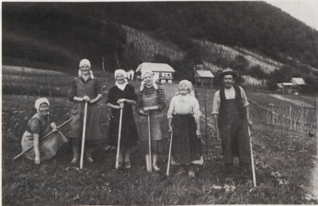
Vsak košček zemlje je bil takrat obdelan, seveda večinoma z motiko