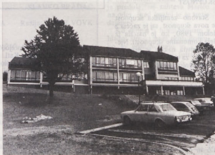
Vzgojno varstvena ustanova v Ločni

Finančni načrt občinske izobraževalne skupnosti je predvideval večino sredstev za zagotovljeni program (dejavnost osnovnih šol) ter za investicije, saj je v izgradnji center usmerjenega izobraževanja, dokončana pa je bila izgradnja prizidkov ekonomske srednje šole in osnovne šole v Stopičah. Izobraževalna skupnost je imela (in jih še ima) velike težave pri