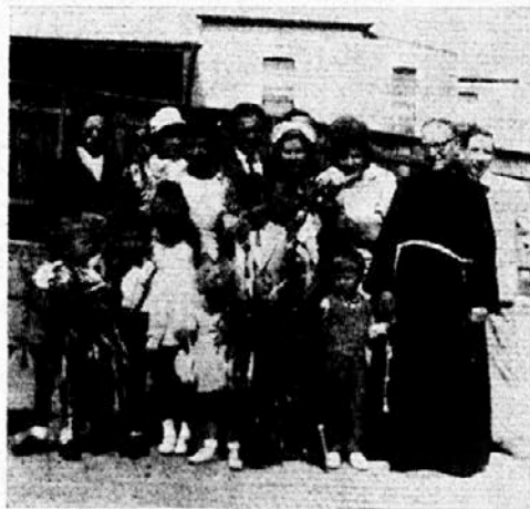
Cvetna nedelja v Leichhardt