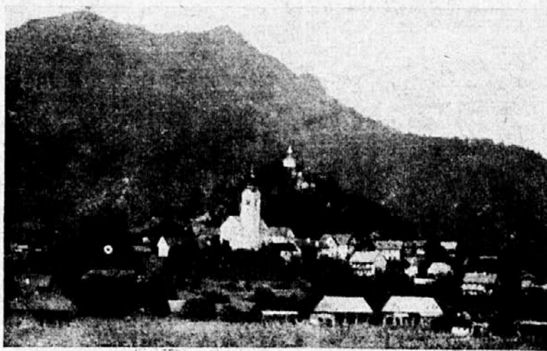
Polhov gradec, zdaj letoviški kraj