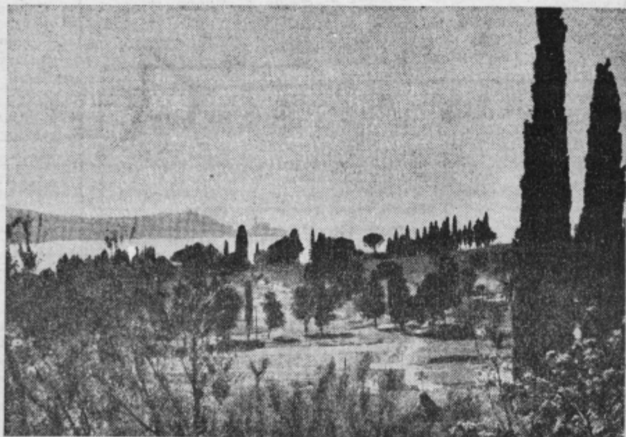
Slovenska obala in slovensko morje sta stara pravica našega naroda in tudi naglo razvijajoče se koprsko pristanišče je dokazalo gospodarsko potrebo svojega zaledja. Kje bi potekala slovenska zahodna meja, če ne bi bilo partizanske IX. korpusa pa si lahko mislimo! Na sliki: naša obala pri Strunjanu

Navdušenje ob zlomu fašistične Italije pa ni zajelo samo primorske Slovence — veseli so bili tudi italijanski vojniki, siti dolgoletnega vojaškega življenja in trpljenja. Veseli so bili italijanski delavci, med katerimi je že dolgo vrelo napredno gibanje in jih pripravljalo na upor proti fašizmu. Zato se je tudi veliko število teh naprednih Italijanov vključilo v slovenske partizanske enote, oziroma so celo ustanovili lastne in jih podredili slovenskemu vojaškemu poveljstvu. Znana je bila Tržaška brigada v sklopu sil IX. korpusa NOV in POJ, prekomorskim brigadam pa se je pridružila divizija »Italies«. Italijanski delavci so namreč spoznali, da sami ne bodo kos masčevalnim nacistom, ki so hitro dovažali v Gorico in Trst nova ojačenja in so že v drugi polovici septembra 1943 začeli veliko ofenzivo proti osvobojenemu ozemlju na Primorskem.