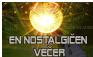
EN NOSTALGIČEN VEČER

(podrobneje na https://discoverptuj.eu/ )