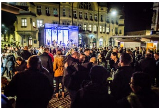
Enega izmed najbolj obiskanih ptujskih martinovanj se je udeležilo več kot 5000 obiskovalcev.