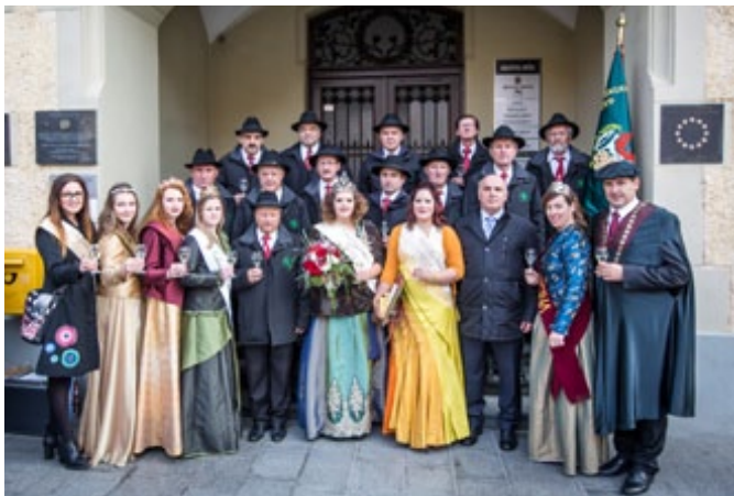
Vinske kraljice v družbi ptujskega župana in članov Društva vinogradnikov in sadjarjev Osrednje Slovenske gorice