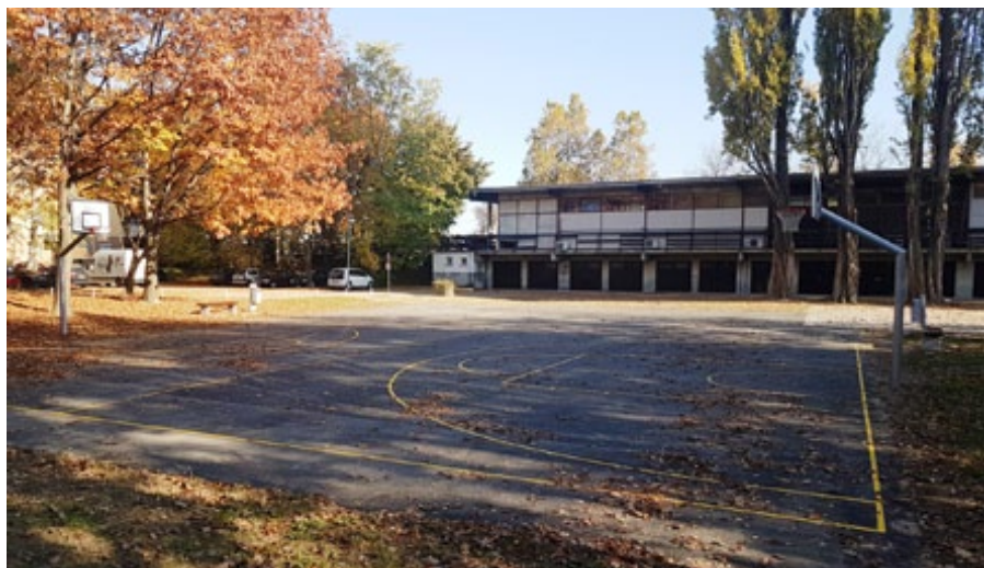
Vsem uporabnikom želimo prijetno in varno igro.