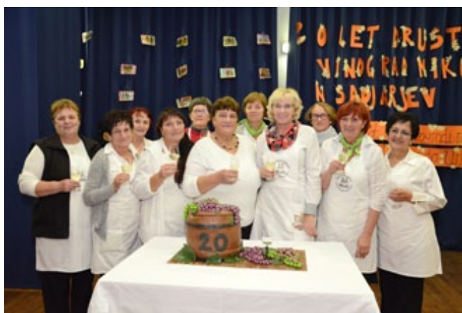
Martinovanje so imeli tudi na Grajeni, kjer so imenovali kletarja, članice Društva kmetič Mestne občine Ptuj pa so razstavljale Martinove jedi in spekle torto v obliki sodčka ob 20-letnici Društva vinogradnikov in sadjarjev Osrednje Slovenske gorice.