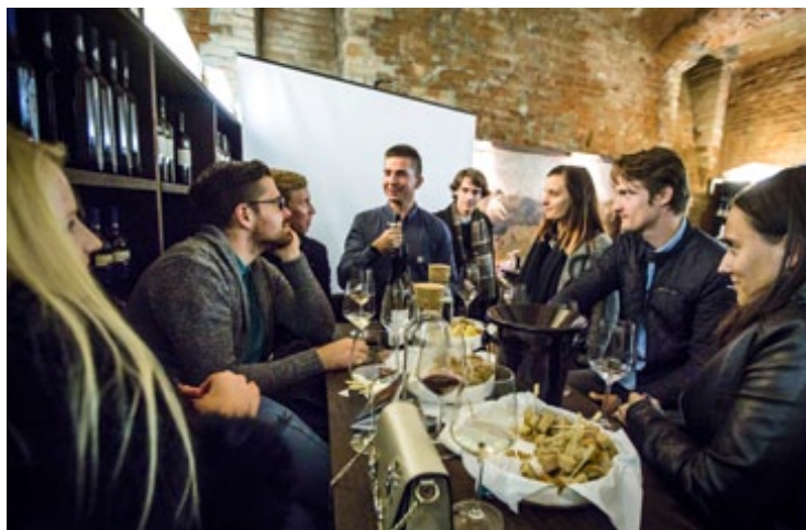
Gostje so lahko pokušali vina Ptujске kleti, vinoteke Kobal Wines ter vinske kleti in vinoteke Osterberger.