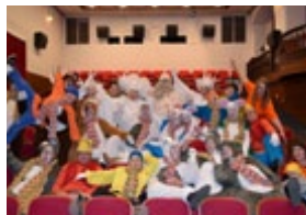
NAVIHANI VESELI DECEMBER