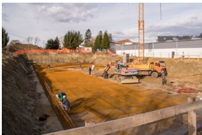
Trenutno so v teku pripravljalna dela za ulitje temeljev in nadaljnjo izgradnjo.