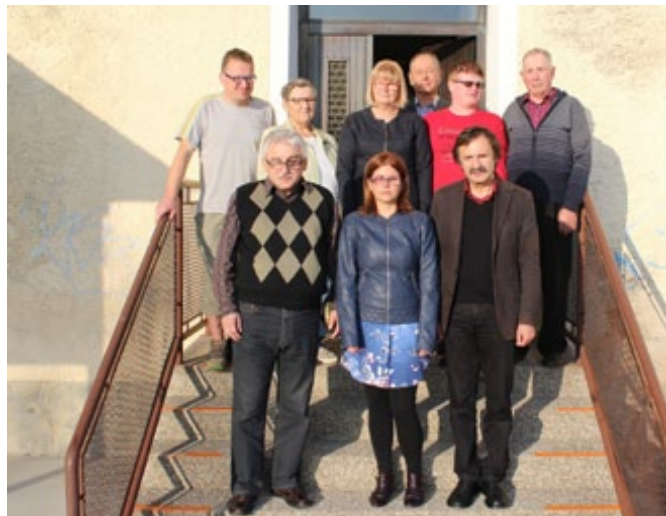
Izvršni odbor MDSS v mandatnem obdobju 2017–2021

Jubilejni dogodek je bil tudi priložnost, da se društvo za sodelovanje simbolično oddolži vsem tistim, ki ga že vsa leta podpirajo. Številnim posameznikom, društvom in klubom so podelili pisna priznanja. MDSS je ob jubileju izdalo tudi zbornik Naša