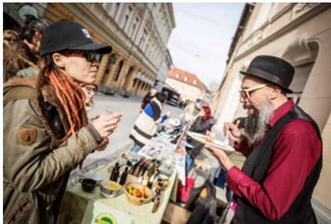
Na dvorišču Fürstove hiše je v okviru Kuhne na dvorišču v organizaciji Zavoda Tura Ptuj dišalo po kulinarčnih dobrotah.