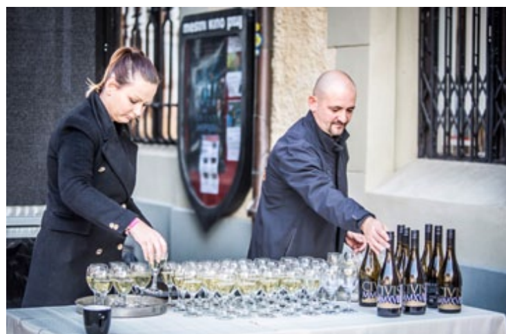
Po inauguraciji vinske kraljice so nazdravili z vinom Cavis iz mestnega vinograda.