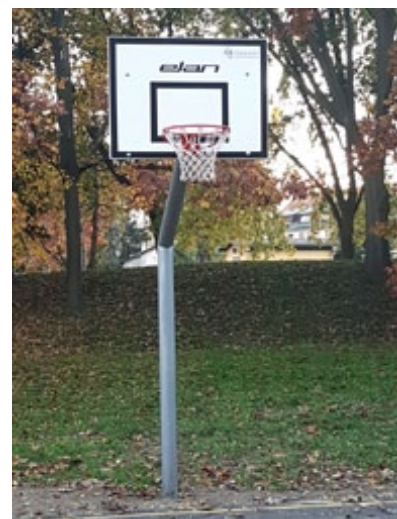
Novi so tudi košarkarske table in obroči.

Mestna občina Ptuj je končala obnovo igrišča za avtobusno postajo. V sklopu del je bilo urejeno odvodnjavanje okrog igrišča, preplastili so košarkarsko igrišče in podlago za učenje rolanja, kotalkanja idr., zamenjali košarkarske table in obroče, postavili klopi in koše za smeti, naredili pa so tudi predpripravo za postavitev otroških igral v letu 2018. V sklopu projekta je bil