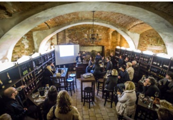
Na predvečer martinovanja so svoja vrata odprle tudi vinske kleti v mestnem središču.