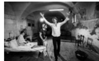
MRAVLJE SO ŠE NA ZVEZDAH