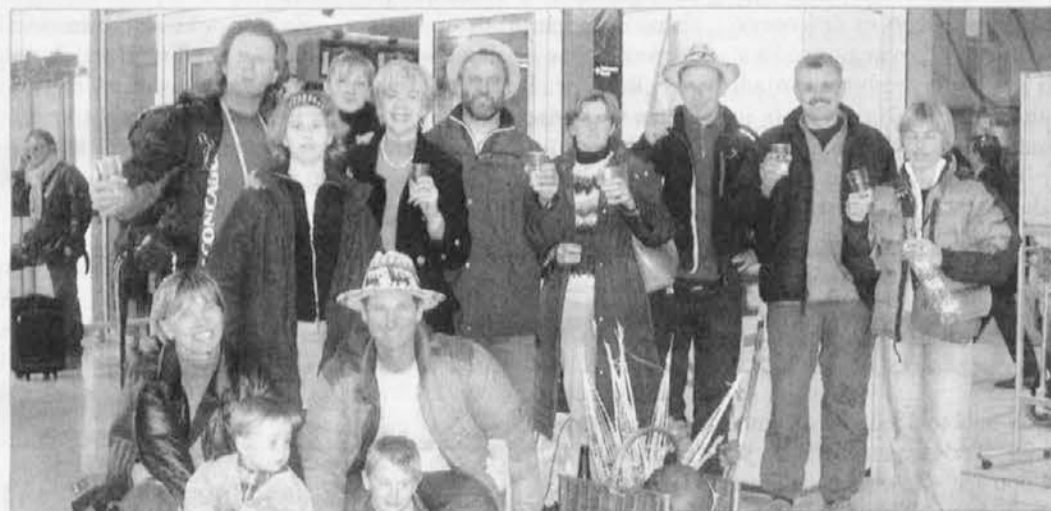
Naši puobi od Planinske družine, ki so šli gor na strieho Amerike