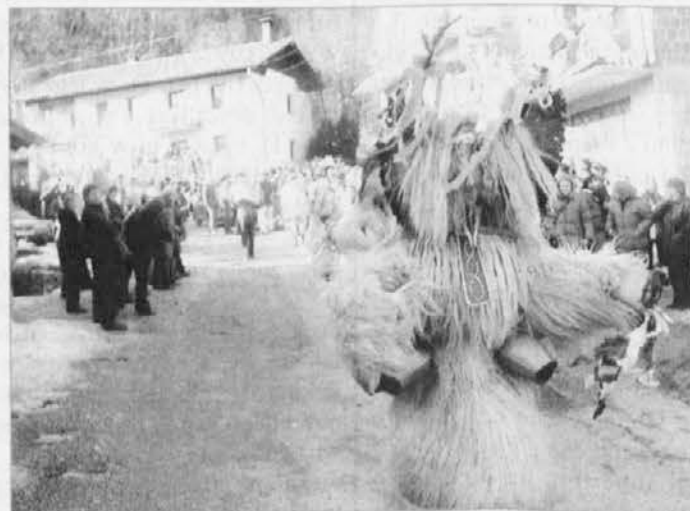
Ob Soči an Nadiži so se za Pust ohranile stare navade

Tudi kulturno društvo Rečan je praznovalo 35 let bogatega kulturnega in