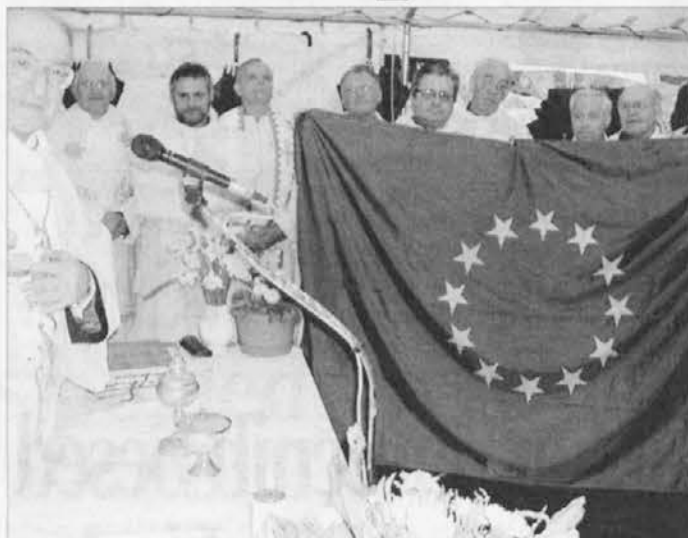
Evropska zastava, ki jo krasi tudi slovenska zvezda, je 30. aprila opolnoči zaplapolala na vrhu Matajurja

V Vidmu so izkoristili priložnost vstopa Slovenije v EU in priredili bogat program z naslovom "Dotik" , na katerem so predstavili današnje kulturno snovanje v Sloveniji na področju arhite-