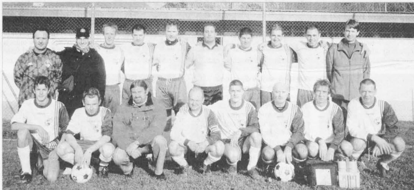
La formazione dell'Osteria al Colovrat di Drenchia che partecipa al campionato amatoriale di Terza categoria

Ancora a riposo la Terza categoria con l'Audace di S. Leonardo che, dopo le ultime