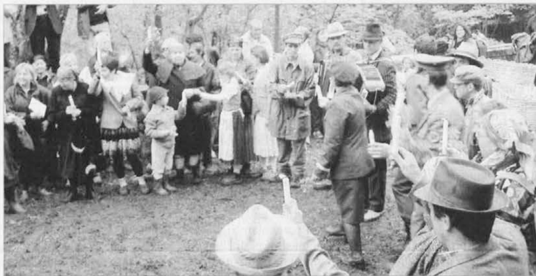
Rodilo se je novo prijateljstvo s sosedi iz Kambreškega konca

dnega izhajanja njegovega predhodnika, Matajurja.