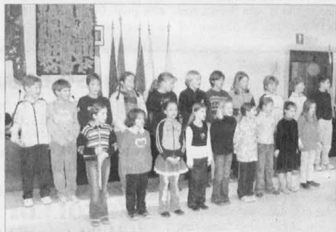
Mali lujerji na prazniku ob 20-letnici Dvojezične šole