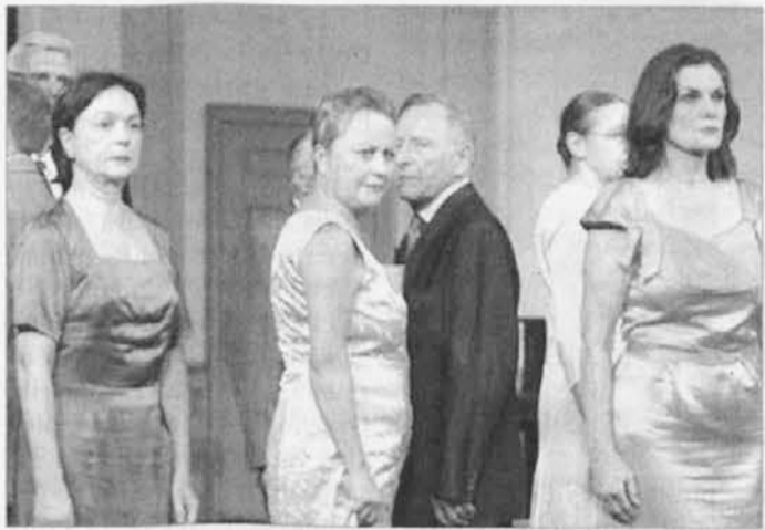
Prizor iz letošnjega Mittelfesta

Praznovanje je bilo 17. decembra, najprej v občinski dvorani, kjer so zapeli Mali