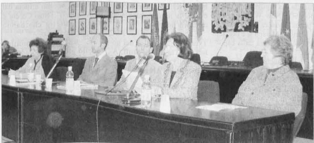
V Trinkovem imenu se je odvijalo več prireditev v Vidmu in Spetru

Sledilo je odprtje dokumentarne razstave v Beneških galeriji, kjer je s dokumenti in fotografijami prikazana dolga pot naše šole do danes.