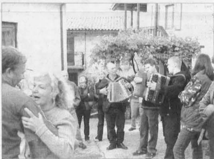
Vesela atmosfera in kulturni program na Burnjaku

bolj prodanega mleka), s katerimi je želela ovrednotiti jezikovno pluralnost videmske pokrajine ter spodbuditi družine, naj vpisejo otroke k dvojezičnemu pouku.