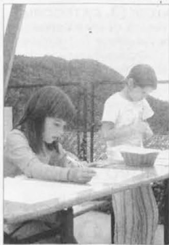
Otroci na Postaji Topolove