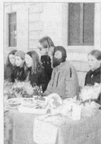
Božični trg v Spetru

Pokazalo se je, da je gozd tudi v Benečiji pomemben vir zaslužka in obenem obnovljiv vir energije. Upati je, da bodo posvetu sledila konkretna dejanja. občina je že predstavila specifičen projekt za ogrevanje občinskih prostorov.