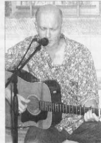
Vlado Kreslin v Benečiji

Aprila je bil natečaj "Kal v poeziji" , ki ga je prvič priredila Občina Podbonesec in