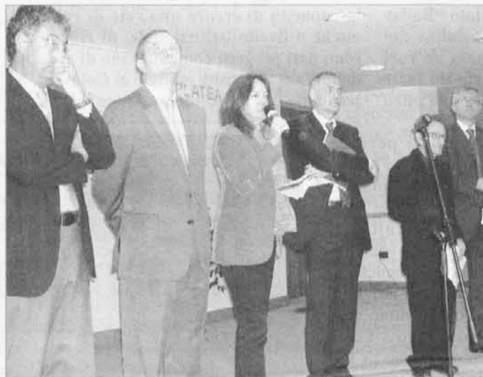
Na pobudo Občine je bil v Vidmu uspešen prvi "Dotik" s kulturnim snovanjem v Sloveniji