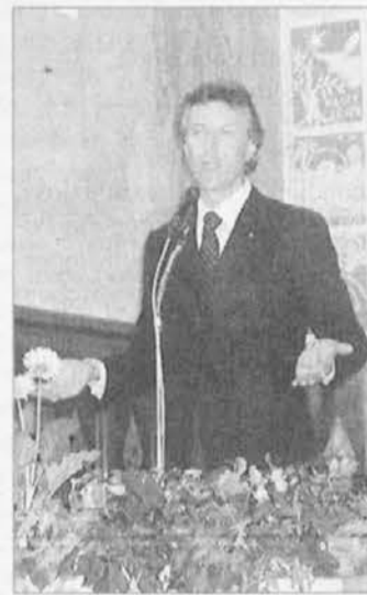
Odbornik Cigolot v Landarju

Junija so bile evropske in upravne volitve , ki so pomenile hud zasak v desno v špetski občini, kjer je po 24. letih zmagala desnica, a ne zaradi svojih zaslug pač pa zato, ker je prišlo do razkola v levosredinskem taboru. Negativne posledice in ozko, zaprto gledanje do manjšinskega vprašanja so v zadnjih mesecih že prišli do izraza. Povsod drugod v