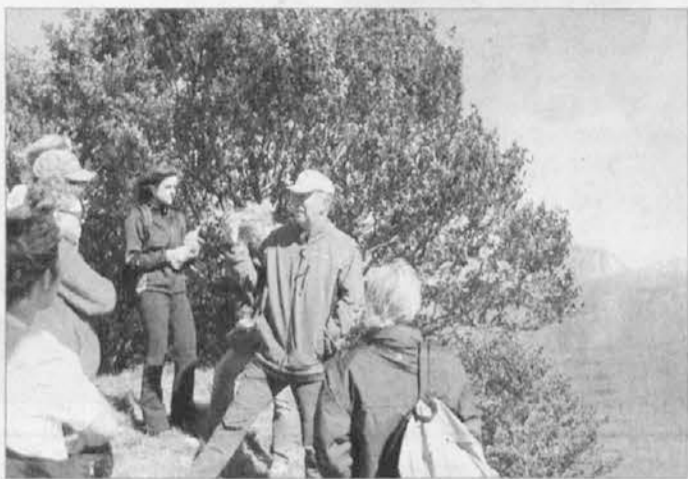
Vodeni obiski po Kolovratu

Na pobudo Pokrajine so jeseni začeli postavljati dvojezične table (furlanske-italijanske, slovenske-italijanske in nemške-italijanske) po vsem teritorju Furlanije z izjemo Rezijske. Pokrajina je sprožila tudi široko propagandno akcijo "Varuj svoj jezik, pomagaj rasti svoji kulturi" (tudi na tetrapaku naj-