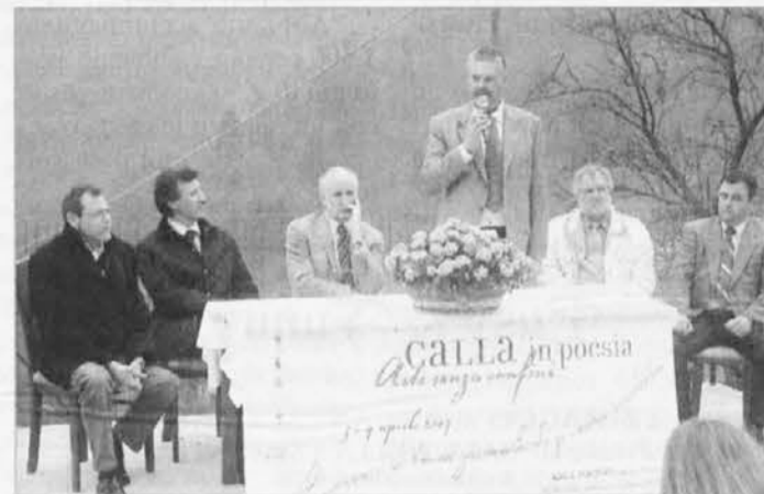
Pesniško srečanje v vasi Kal v Podbonescu

Bil je tudi narečni natečaj "Nas domači izik" , ki ga je