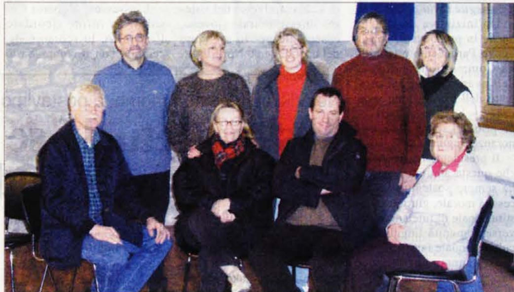
Tudi lietos Beneško gledališče, ki mu bo pomagala skupina mladih, nam parpravja novo delo, ki nam bo na začetku zaparilo sapo, potlé pa se nam store veselo smejet