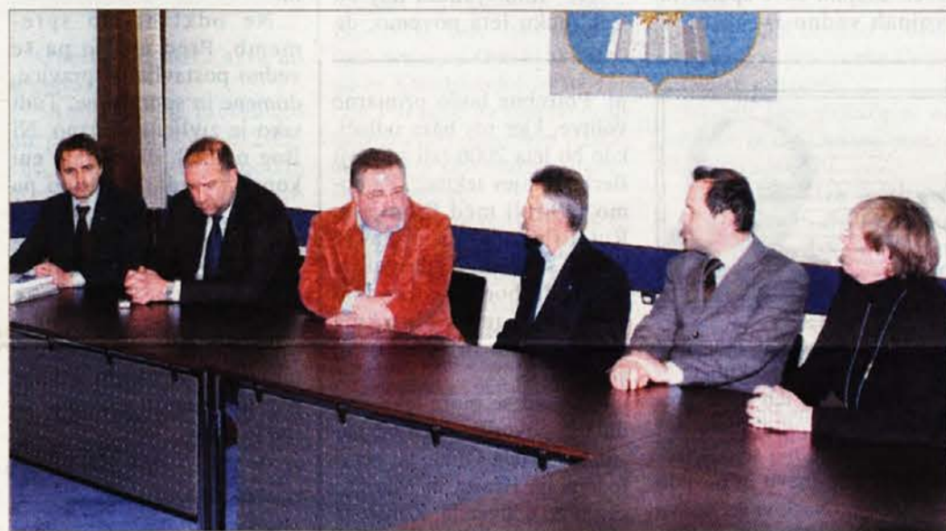
Il presidente Illy e l'assessore Cosolini con i rappresentanti dell'Unione culturale economica slovena - SKGZ