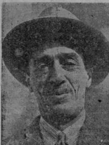
Vojvoda Alba, španski nacionalistični poslanik v Londonu. Imenovanega se hoče poslužiti Anglija za posredovanje v španski državljanski vojni