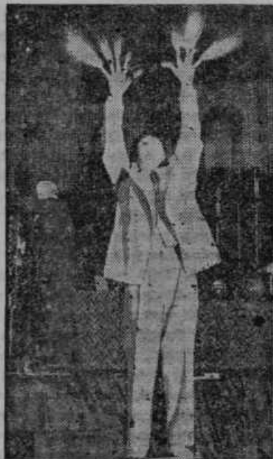
Irwin A. Moon v Čikagi, ki je oznanjevalec neke nove vere in znanstvenik, si pusti mirno napejati skozi telo milijon voltov električnega toka, katerega vidimo izžarovati skozi prste na rokah

orisal številnim zbranim življenje in delovanje blagopokojnega. Iz cerkve se je pomikal dolgi sprevod v Rogoznico na pokopališče. Poleg ljudskih množic je posodilo g. vikarju zadnje pot nad 30 svetnih du-