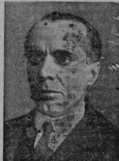
10 let je minulo od ponesrečene italijanske ekspedicije z zrakoplovom »Italia« na povratu od severnega tečaja. Odpreme je vodil general Nobile

Vsi mokri in vlažni zidovi v stanovanjskih prostorih so našemu zdravju silno škodljivi,