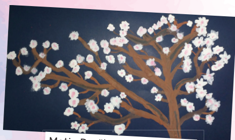
Matic Draškovič, 5. razred