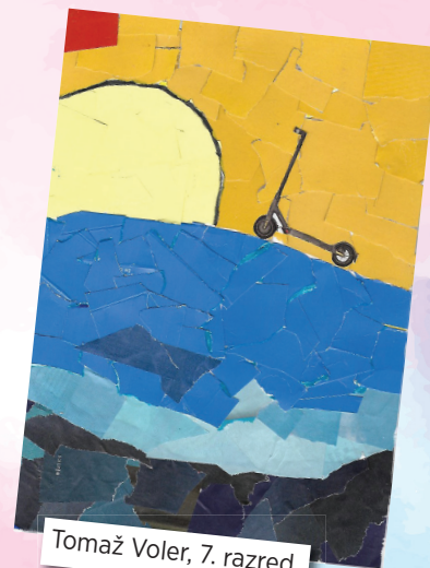
Tomaž Voler, 7. razred