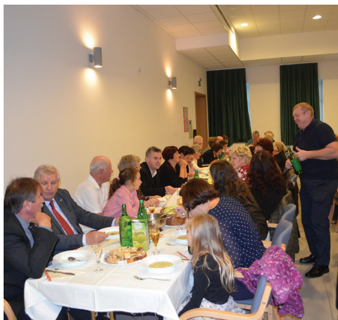
Vabljeni gostje na Občnem zboru DU Žetale leta 2019, ko ni bilo epidemije.

Plan dela DU Žetale za leto 2021 opredeljuje aktivnosti, ki jih bo društvo izvedlo v takšnem obsegu, kot ga bodo dopuščale zdravstvene razmere. Tako bi v letu 2021 izvedli dva izleta. Prvi izlet v