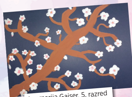
Anamarija Gajser, 5. razred