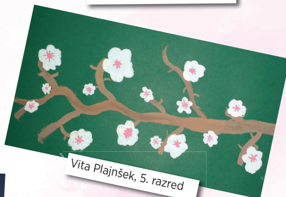
Vita Plajnšek, 5. razred