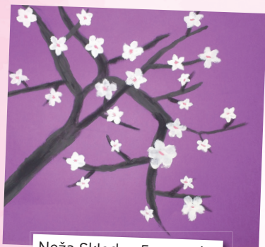
Neža Skledar, 5. razred