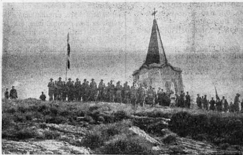
Spomen-kapela na Kajmakčalanu.