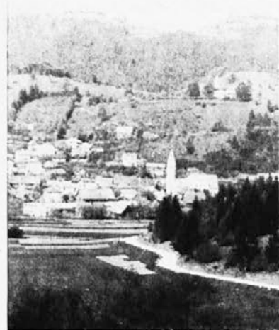
Sodražica — središče rešetarjev