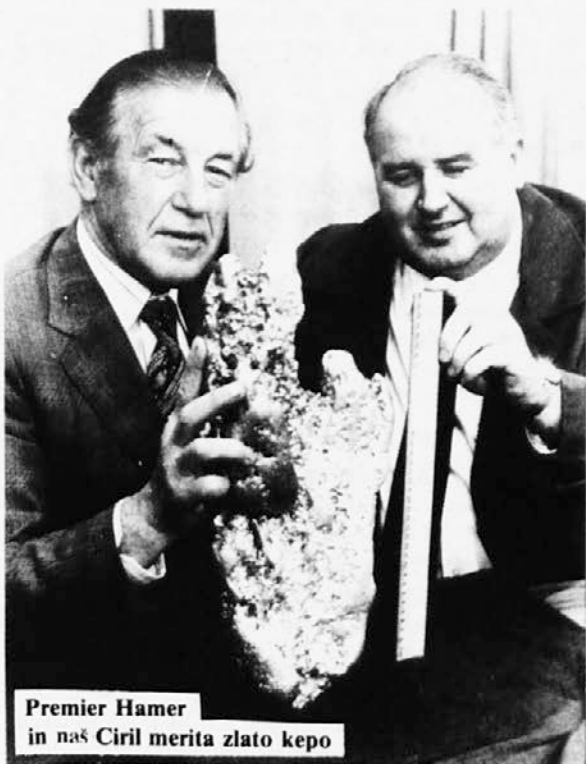
Premier Hamer in naš Cyril merita zlato kepo

Kot omenjeno: na državni zemlji — "Crown Land" ji pravimo. Ne pa seveda na zasebni posesti.