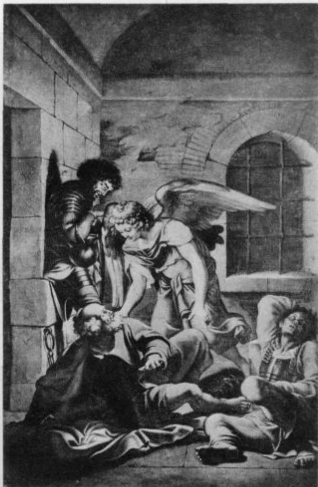
Zampieri dello Domenichino.