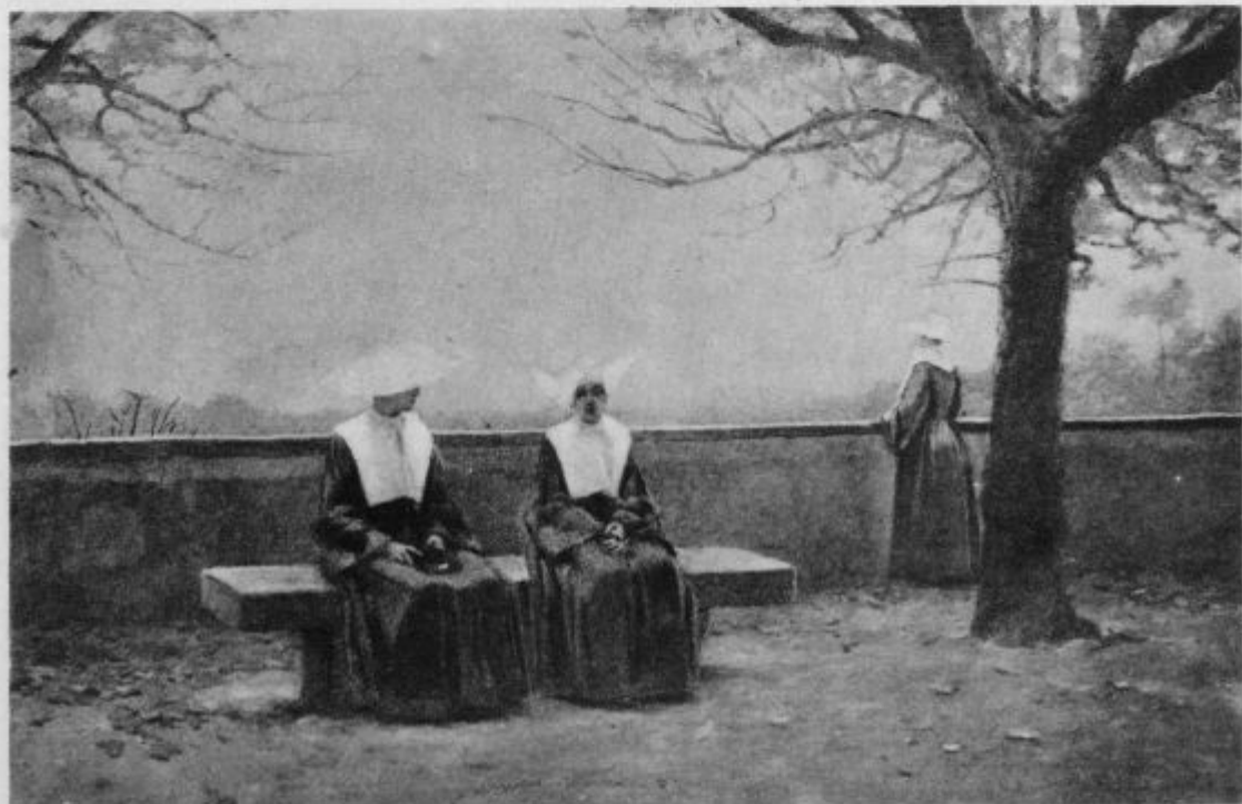
Na samostanskem vrtu.

Pri mizi zlasti je izvedela Elizabeta zadosti o težkih prilikah sv. Cerkve, pa jo je vzljubila tem bolj, ker jo je ljubila z bridkostjo. Vedela je seveda, da je Cerkev zidana na skalo, na tako močno skalo, da je peklena vrata nikdar ne bodo premagala; skala, ki stare vsakega, na kogar pade, in ki se nanji razdrobi vsak, kdor nanjo pade; vendar je kljub temu daro-