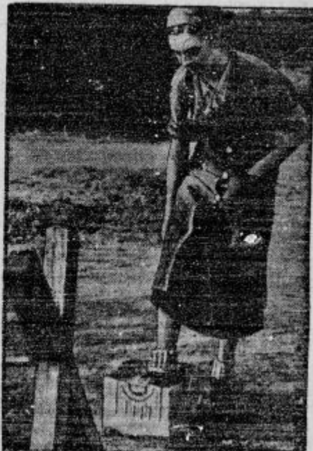
Goveja kuga uničuje kmetovo premoženje že po vseh koncih Evrope. Mogoče bo prišla tudi k nam. Slika kaže, kako v Švici ljudje razkužujejo čevlje, da ne raznašajo bolezni iz kraja v kraj.

d Povest o ugrabljenih dekletih. Kar 749 ugrabljenih deklet so v desetih letih zabeležile naše oblasti. Ugrabljenje ali »otmica« je pogost pojav v južnih in vzhodnih krajih naše države,