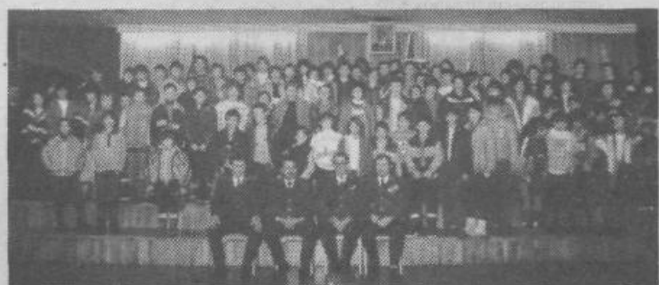
Udeleženci letošnjega kviza pionirjev-gasilcev, ki je bilo v OŠ Karla Destovnika-Kajuha v Štepanjskem naselju