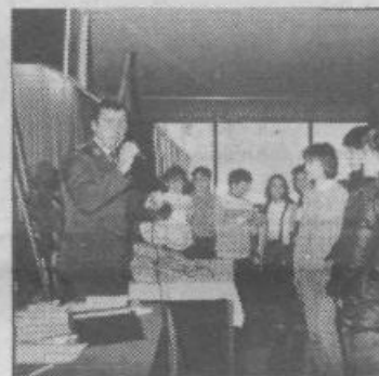
Prvovršeni trojki pionirjev-gasilcev iz GD Bizovik in GD Lipoglav med kvizom

Največ znanja je prikazala trojka GD Bizovik I, druga so bila dekleta — gasilke GD Lipoglav, tretji pa pionirji iz druge