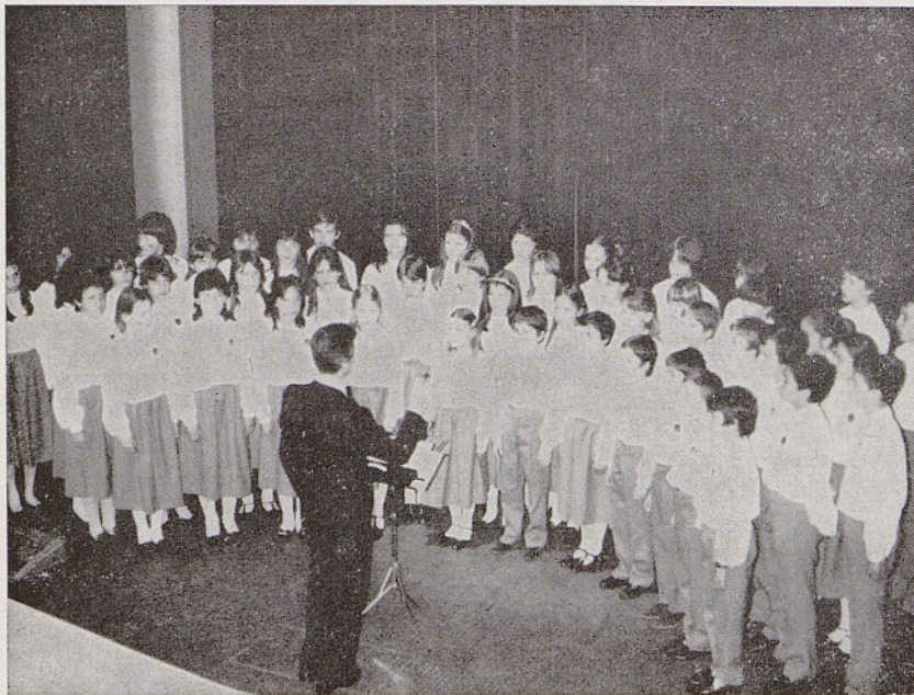
Zbor Vesela pomlad je 16. oktobra zaključil letošnje Primorske dneve na Koroškem

RAST, mladinska priloga Mladike 7/83. Pripravlja uredniški odbor mladih. Tisk Graphart, Trst, oktober 1983. To število je uredil Marijan Kravos.