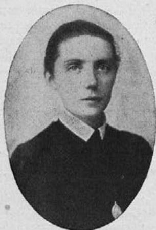
Služabnica božja Marija Terezija Ledóchowska