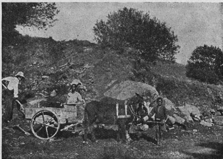
Misijonar opravlja posel zidarja: dovaža pesek za novo misijonsko cerkev