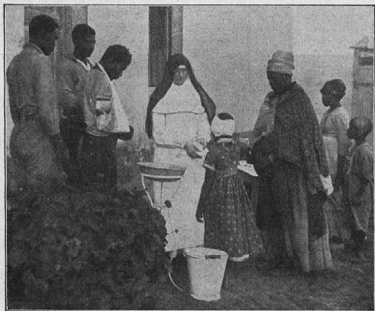
Strežba bolnikov v misijonu Swakobmund