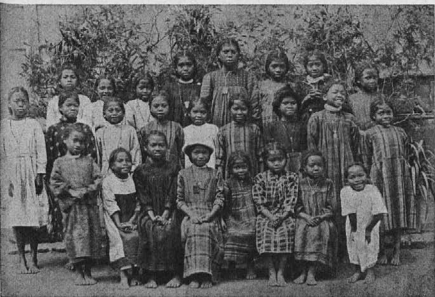
Zamorčki iz misijona Tananariva

Torej na delo! Denem si puško na rame, vzamem s seboj nekaj domačinov, da mi kažejo pot.