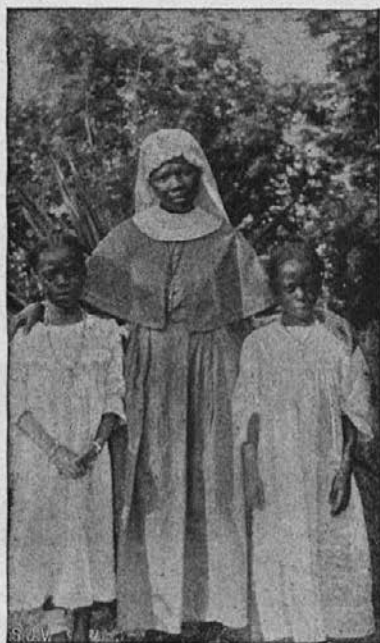
Sestra domačinka s sirotama

Za vse to se zahvaljujem Vaši Klaverjevi družbi in blagim dobrotnikom in prosim Boga, da vsem po božje povrne! Večkrat opravim sv. mašo za dobrotnike. Upam, da bo Bog že na tem svetu povrnil Vam in vsem misijonskim prijateljem.