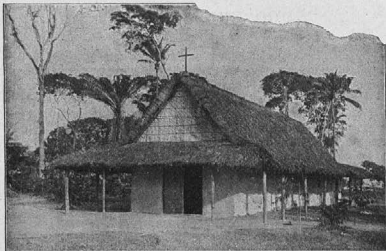
Siromašna misijonska cerkvia