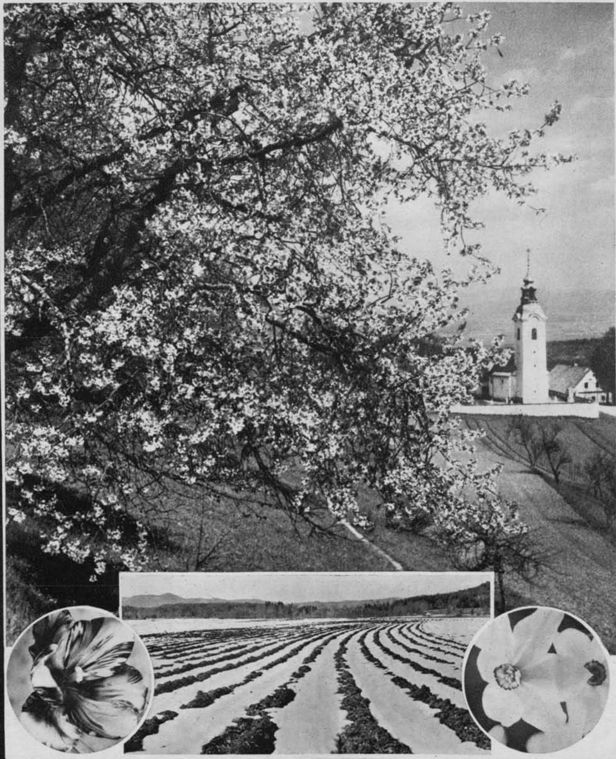
KOCJANČIČ: SV. KATARINA SPOMLADI SPODNJE TRI: SKERLEP: TULPA, ZADNJI SNEG, NARCISA

T E D E N S K A · P R I L O G A · S L O V E N C A