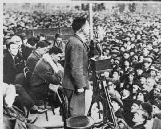
Na levi: Novi predsednik irske republike, De Valera, je oprostil vse politične jetnike, ki so priredili takoj naslednji dan ogromni shod v Dublinu za popolno neodvisnost Irske.

Spodaj: Ogromna električna centrala ob Jordanu blizu Genezarskega jezera, ki je bila pred kratkim otvorena in ki bo preskrbela vso Palestino z elektriko.