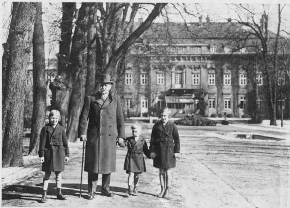
Generalfeldmaršal Hindenburg (s svojimi vnuki), ki bo danes vnovič izvoljen za predsednika nemške republike; v ozadju palača držav. predsednika.