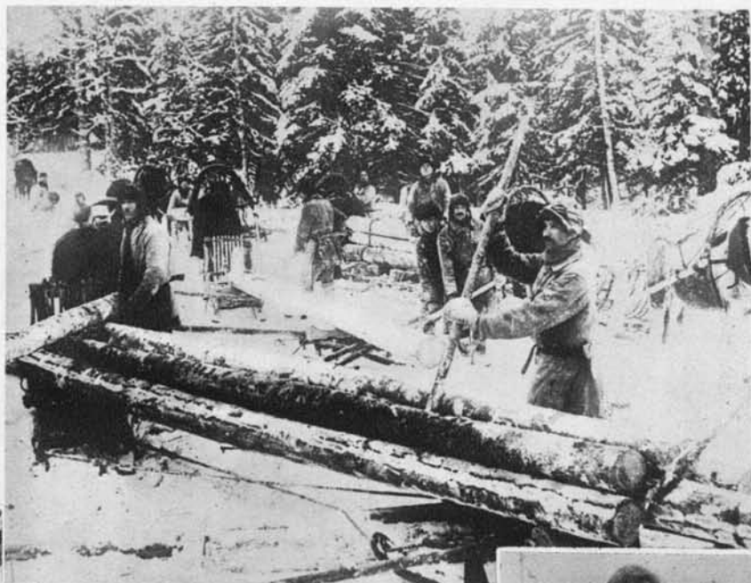
Pogled na gozdne delavce v guberniji Arhangelsk (Sev. Rusija).

Lani se je na velikih svetovnih tržiščih pojavil ruski dumping, ki je dal vsemu svetovnemu tisku povod za obširno razpravljanje o sovjetskih produktivnih metodah in o socialnem položaju ruskega delavstva. Ob tej priliki se je vztrajno trdilo, da o kaki delavski svobodi, ki jo obetajo komunisti pri svoji agitaciji, vsaj v Rusiji ni niti sledu in da živi velik del ruskega delavstva na eni strani v vprav nečloveških socialnih razmerah, na drugi strani pa tudi v pravem suženjskem razmerju. Zlasti so opozarjali na mase gozdnih delavcev po neizmernih gozdovih severne Rusije, kjer je zaposlenih na desetisoče političnih jetnikov, katerih edini pogrešek je ta, da niso komunisti. Glede zatiranja svobode mišljenja sovjeti pač več kot uspešno tekmujejo z nekdanjim carizmom, zato morata biti oba sistema vsakemu, ki še kaj da na človeško dostojanstvo, enako odurna. Danes prinašamo iz teh severnoruskih gozdov vrsto slik.