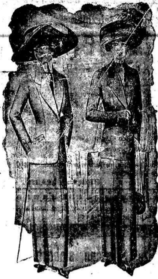
1 Coupon samo K 13.50 imit. angl. sukno.