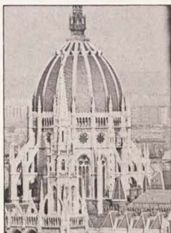
Budimpešta: stolp skupščine

Ugledni koroški književnik, pisatelj in dramatik Peter Handke (slika) je v nemškem dnevniku „Süddeutsche Zeitung“ objavil kritičen članek o Sloveniji, ki je močno odmeval tako v nemško govorečem prostoru kot v sami Sloveniji. Objavljamo nekaj najpomembnejših Handkejevih izpovedi.