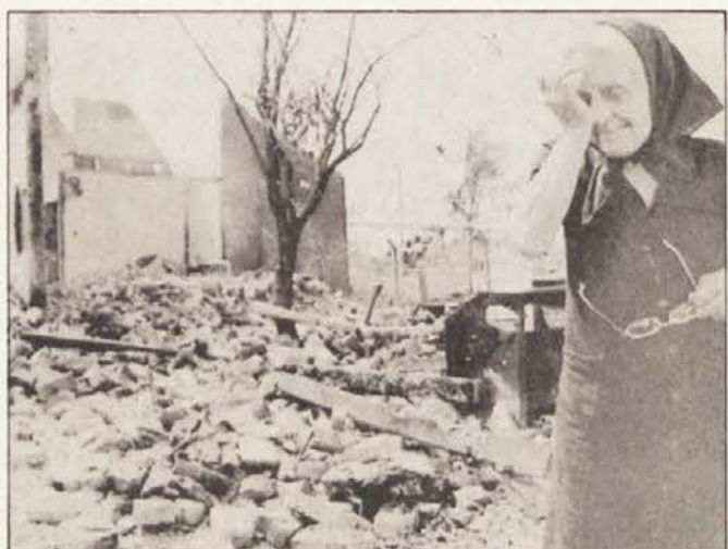
Prizor iz nesmiselne vojne v vasi Okučani na Hrvaškem