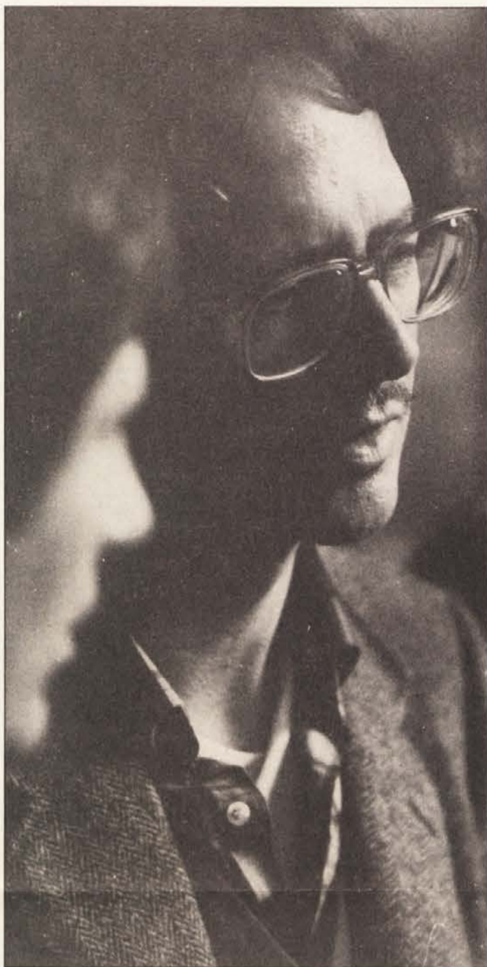
Koroški književnik, pisatelj in dramatik Peter Handke

Slovenija je že od nekdaj spadala v veliko Jugoslavijo, ki se je začela južno od Karavank in se nehala daleč na jugu, recimo v Ohridu, ob bizantinskih cerkvah in islamskih mošejah pred Albanijo