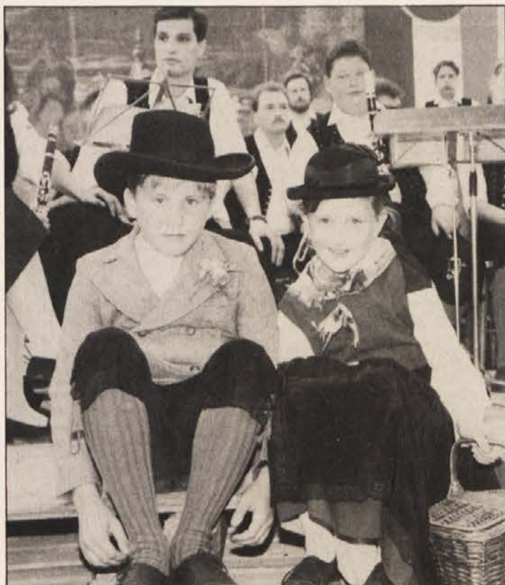
598. pliberški „jormak“ je spet bil veliki dogodek

Letališča so preteklo soboto – po uradni, beograjski verziji – zaprli zaradi letala ugandske letalske družbe, ki so ga lovci jugoslovanske armade prisilili, da pristane na zagrebškem letališču. V tem letalu so našli 19 ton orožja in streljiva, ki naj bi bilo namenjeno hrvaškim varnostnim silam.