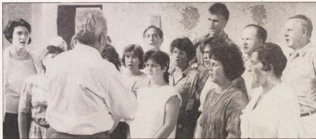
Odrptje slikarskega tedna so popestrili domači pevci.