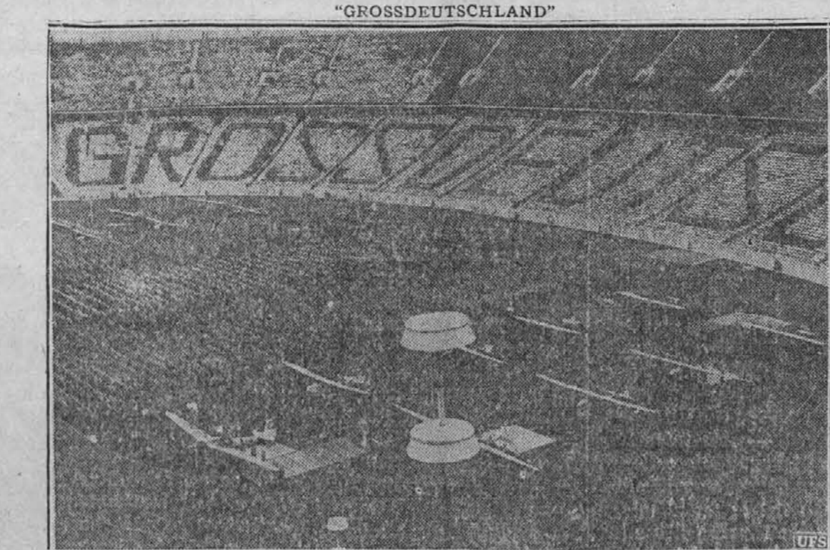
Predno je Hitler odšel na obisk v Rim, mu je nazijeka mladina priredila v olimpijskem stadiju sijajne manifestacije, kakor kaže slika. Zanimiv je napis Grossdeutschland — Velika Nemčija, ki je bil sestavljen iz "živih črk". Črke so stvorili dečki, oblečeni v črne uniforme, ozadje pa tvorijo bele obleke dekl.