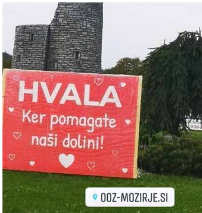
Zahvala OOOZ Mozirje za pomoč ob ujmi