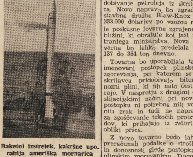
Raketni izstrelak, kakršne uporablja ameriška mornarica