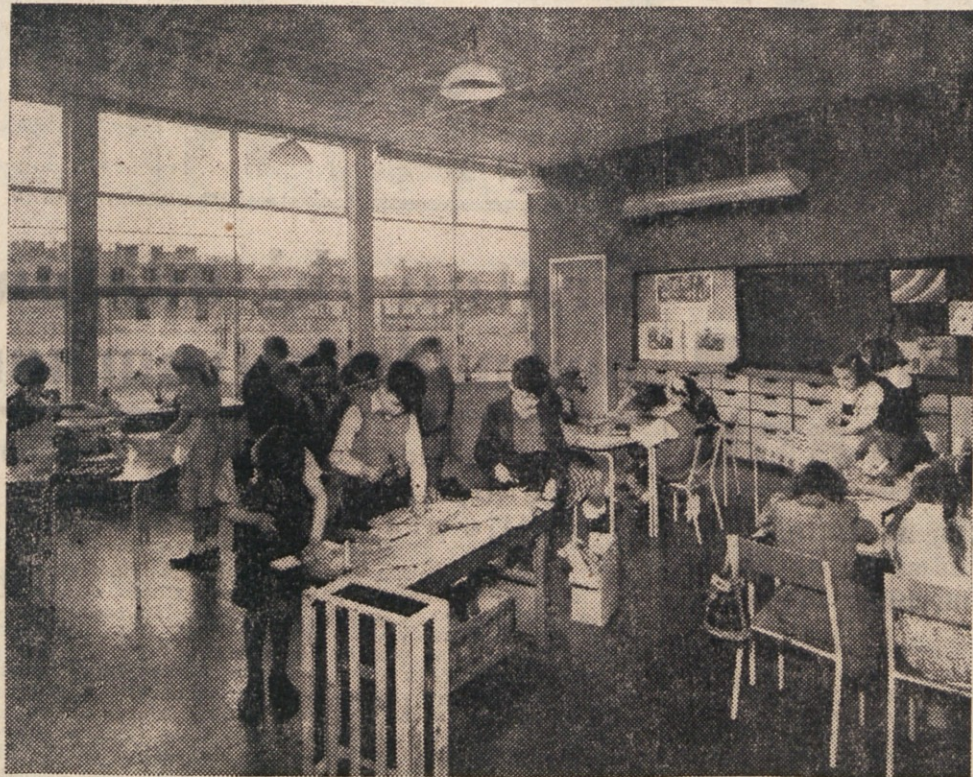
Taka sola ni dolgočasna; toda pri nas še nismo tako daleč, da bi že imeli take vrste sole. Našo solo še vedno mori togi oklep italijanskega neživljenjskega šolskega sistema