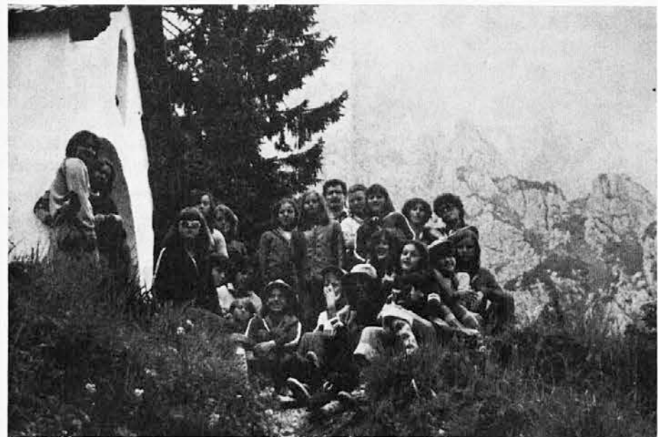
Skupina goriških skavtini pri kapelici v Rifugio De Gasperi

Nebo je bilo nizko in živo; že cel dan je bilo brez prestanka; prostor je izgledal zaprt in temačen; potok je komaj zadrževal vodo, nižje doli ob mostu pa je ta že stopila iz svoje struge in poplavila stezo, da se ni videlo meje med potokom in cesto. Sotori so se upogibali pod težo obilnega dežja, vse okrog njih pa je bilo puho.