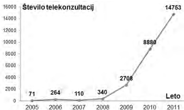
Slika 2 Število telekonzultacij v obdobju 2005-2011.

Z reorganizacijo transfuzijske službe je število telekonzultacij skokovito naraslo (slika 2) in izkazalo se je, da informacijski sistem ni bil zasnovan za takšen obseg dela. Kot rečeno, je sistem za izvajanje nekaj sto telekonzultacij letno postopoma prerasel v sistem za izvajanje 15.000 telemedicinskih storitev letno, pri čemer smo kljub razširitvam in nadgradnjam izčrpali vse možnosti obstoječe platforme. Zato smo se odločili, da zasnujemo nov sistem, ki bo s profesionalno izvedbo poskrbel, da bomo še naprej neprekinjeno zagotavljali varno preskrbo bolnišnic s krvjo.