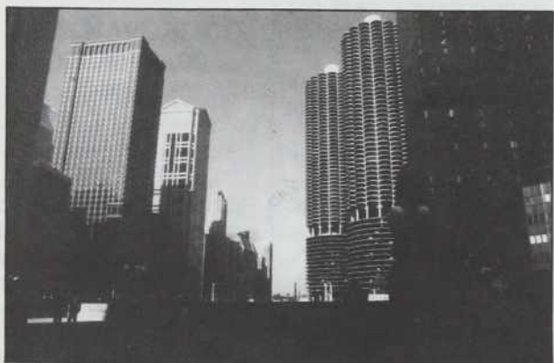
Ob reki Chicago, ki se izliva v jezero Michigan, stojijo visoke in zanimive zgradbe. Takoimenovana koruzna storža sta v spodnjem delu namenjena avtomobilskim garažam, v zgornjem pa so stanovanja in nobeno ni brez balkona.