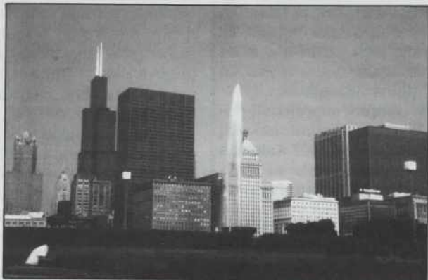
V "šopku" chicaških stolpnic je najvišji 110 nad-stropni Sears Tower. 443 metrov visoka zgradba je tudi najvišja na svetu, na njen vrh pa vozijo dvigala pičlih 70 sekund. Tako so tudi dvigala naj, in sicer najhitrejša na svetu.

Obala michiganskega jezera nudi od plaže do prijetnih sprehajalnih in drugih rekreacijskih poti, vsekakor pa tudi pristanišče mnogim ladjam, ki plujejo iz enega v drugo ogromno jezero. Je pa v Chicagu tudi veliko muzejev vseh vrst, znanih poslovnih in drugih hiš, če pa radi berete, recimo, romane in novele