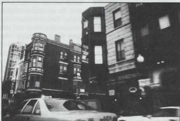
Staro mesto, v katerem je po letu požara, torej 1871, nastala nemška mestna četrt, katere ulice se imenujejo po znamenitih nemških umetnikih. Sicer pa je v Old Townu najbolj pestro ob večerih, ko po njem vozijo konjske vprege in se iz mnogih barčkov in lokalov razlega prijetna glasba.

"Amerika, pozdravljena," sva z življenjskim sopotnikom dejala, ko sva z dunajskega letališča stopila iz ogromne jeklene ptice na letališču O'Hare v Chicagu, ki je baje najbolj prometno mednarodno letališče na svetu. Američani imajo sploh zelo radi, da je nekaj naj in v Chicagu je veliko tega. Recimo najvišja stolpnica na svetu, pa najdaljša ulica na svetu, pa... Eh, kaj bi s tem,