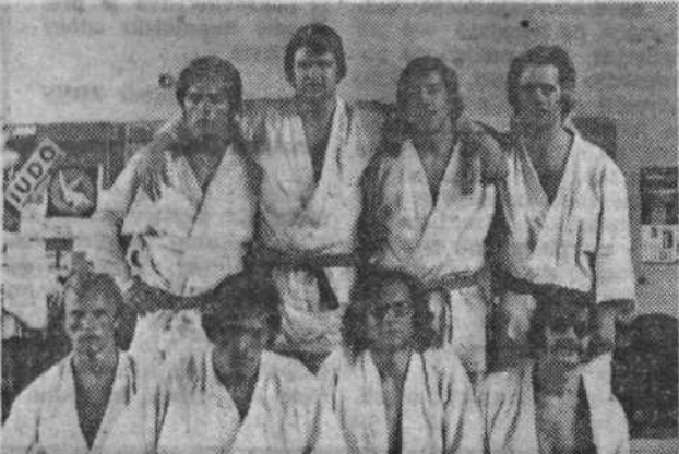
Ekipo Judo kluba Bežigrad, ki je zasedla prvo mesto v II. republiški ligi.