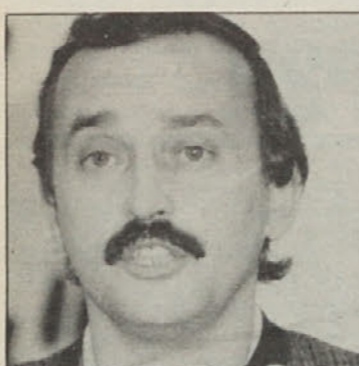
Predsednik Kluba slovenskih občinskih odbornikov se je izrekel proti samostojni kandidaturi na državnozbornih volitvah: „90% občinskih odbornikov je proti!“