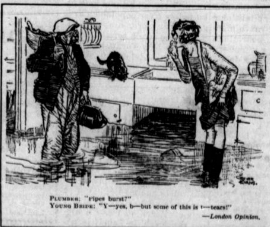
PLUMBER: "Pipes burst!" YOUNG BRIDE: "Y—yes, b—but some of this is—tears!" —London Opinion.

Capitalism feeds the worker so long as he is employed but the horse gets his rations whether he works or not.