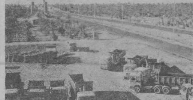
Gradisovi delavci grade v sotočju Evfrata in Tigrisa sistem mostov

Nastop na inozemskem trgu in izvajanje investicijskih del se iz dneva v dan zaostrejuje najmanj iz treh razlogov: 1. močnejša konkurenca drugih držav, 2. slabšajo se pogoji, pod katerimi tuji investitorji ponujajo gradnjo novih objektov, ob istočasni nesposobnosti nekaterih dežel, v katerih gradimo, da plačajo svoje obveznosti in 3. togost našega sistema, ki s številnim in dostikrat nepotrebnim administriranjem omejuje hitrejši blagovni izvoz. Dosti je nedorečenih stvari, predvsem v zvezi z uvozom blaga za izvoz. C.P.