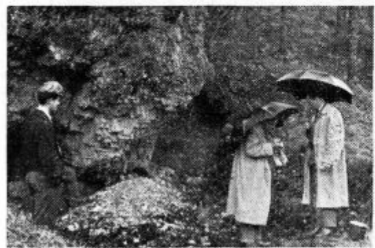
Komisija za male asanacije na delu v Šebreljah

Vas Šebrelje je bila med NOB zatočišče partizanov, zato jo je okupator leta 1944 skoraj v celoti požgal in porušil. V povojni izgradnji so Šebreljčani za obnovo vasi prispevali velik de-