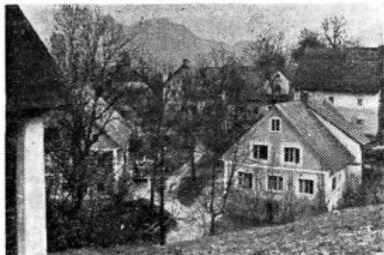
Šebrelje: spodnja vas

V vasi je tudi nov vodovod, ki so ga vaščani zgradili leta 1955 ob podpori Rdečega križa