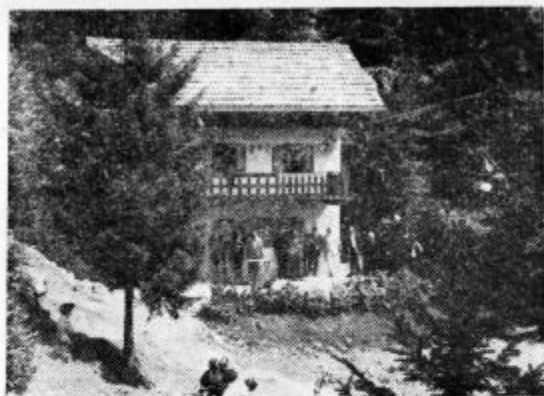
Lovska kočja na Jelenku

V gradnjo je bilo skupno vloženo 3585 prostovoljnih ur dela v skupni vrednosti 284.080 dinarjev. Tudi nelovci so prispevali 1183 delovnih ur. Najpožrtvovalnejši je bil starejši lovec Franc Carl iz Sp. Idrije, ki je opravil 214 ur. Za pomoč v materialu pa se je posebno zahvalil Avto-