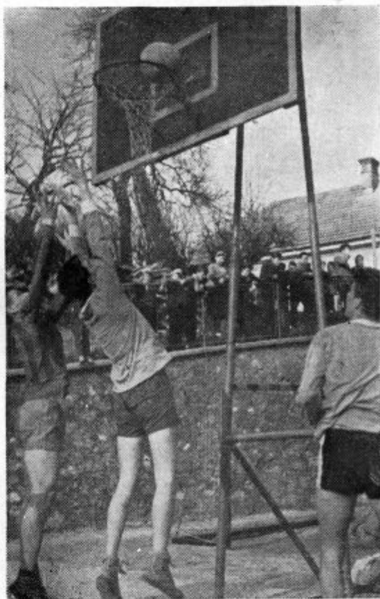
Otvoritev igrišča za gimnazijo 9. IV. 1960

Za vstop v slovensko ligo je bilo treba odigrati še kvalifikacijske tekme, kamor bi bili morali oditi Cerkljani, ki pa imajo samo šolsko