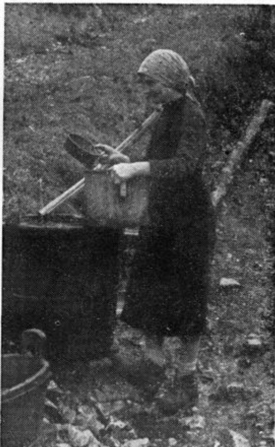
Nezdrav studenec v Šebreljah

Vzrok, da ima vas slabo pitno vodo, leži v glavnem v starem vodovodu iz leta 1906 s popolnoma preperelim in dotrajanim omrežjem. To slabo omrežje vodovoda in zajetja pa okužujejo neurejena gnojišča in stranišča v vasi.