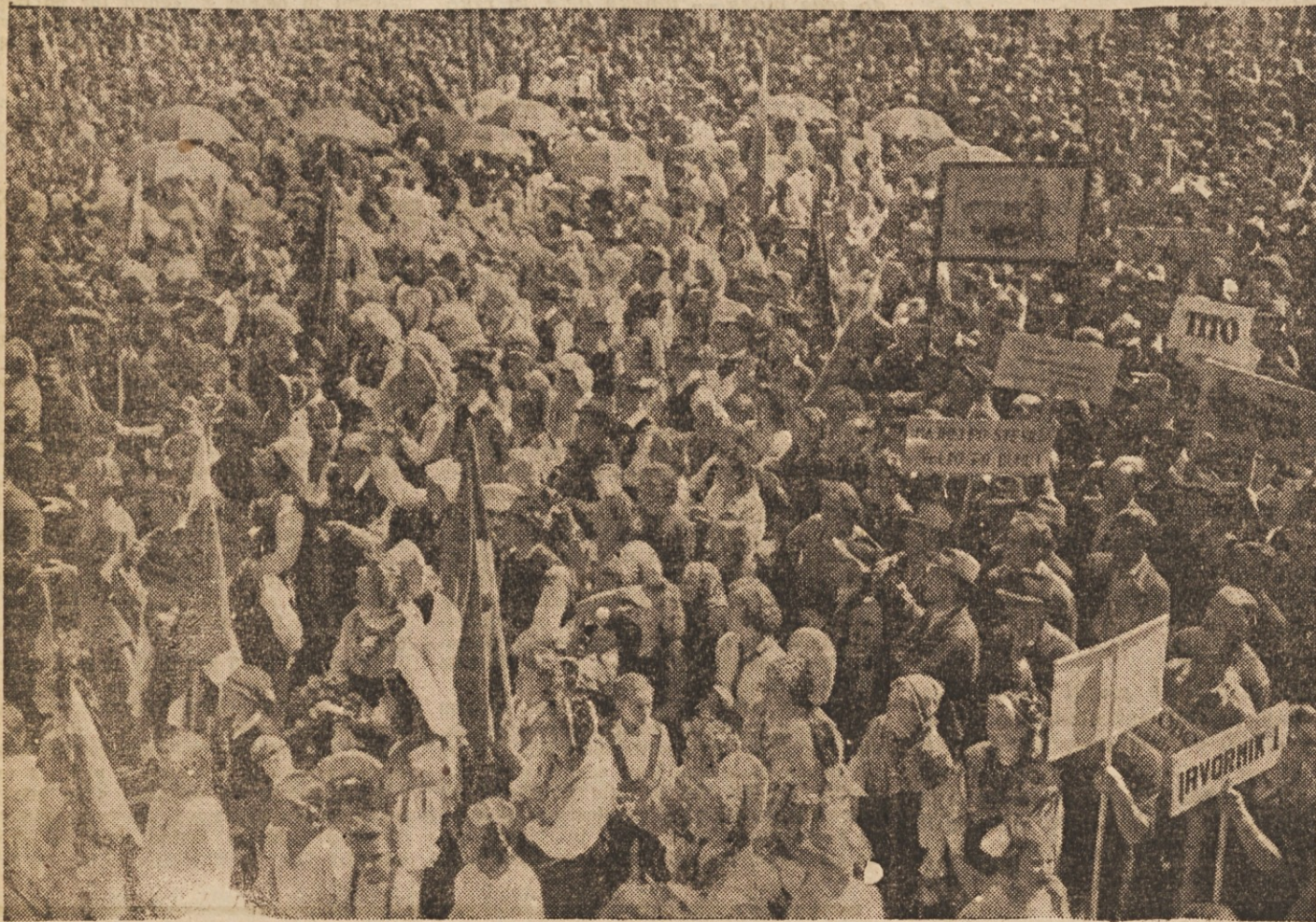
Z jeseniškega festivala: nepregledne množice delovnega ljudstva v povorki