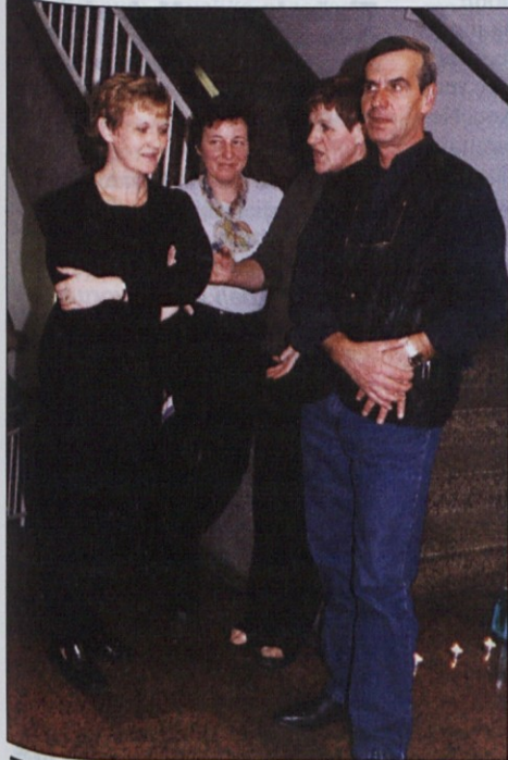
Zaposleni v blagovnici so bili na predstavi zelo v ozadju.