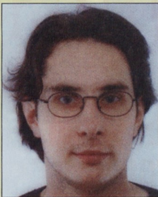
Piše: Jure Snoj, svetovalec ZSSS