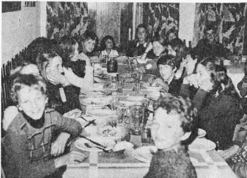
Otroci «Mlade brieze» težko čakajo na kosilo