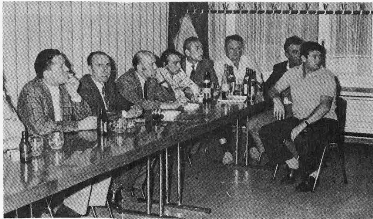
Na sliki naši emigranti v Luzerni diskutirajo o svojih težkih problemih

Kulturna društva, odbor za proslavo 30. letnice osvoboditve, Zveza beneških emigrantov in A.N.P.I. iz Benečije se globoko zahvaljujejo tržaškemu Partizanskemu pevskemu zboru za nepozaben nastop v teatru «Ristori» v Čedadu na osrednji proslavi 30 letnice osvoboditve.