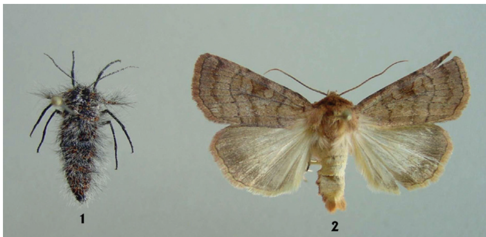
Sl. 2: Primerki na novo najdenih osebkov: 1- samica vrste Lycia isabellae , 2 – samček vrste Xestia sexstrigata .