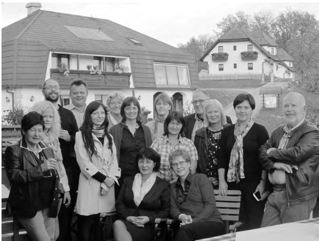
Slika 1 Udeleženci SIZN 2013.

kažejo na večanje potreb po storitvah dolgotrajne oskrbe. Slovenija še nima zakonske regulacije tega področja. Oskrbo pacientov v domačem okolju izvajajo patronažne medicinske sestre in socialne oskrbovalke. Pri izvajanju storitev je njihova povezava šibka in temelji le na osebnem nivoju. Na samostojnost pacienta pri samooskrbi vpliva več dejavnikov. S poznavanjem teh dejavnikov lahko vplivamo na ohranitev in izboljšanje samooskrbe ob preventivnim in rehabilitativnim delovanjem interdisciplinarnega tima. Računalniška podpora izvajalcem dolgotrajne oskrbe vnaša tudi spremembo v pristopu k pacientu, poudari njegovo aktivno vlogo tudi v prevzemanju odgovornosti za lastno zdravje.