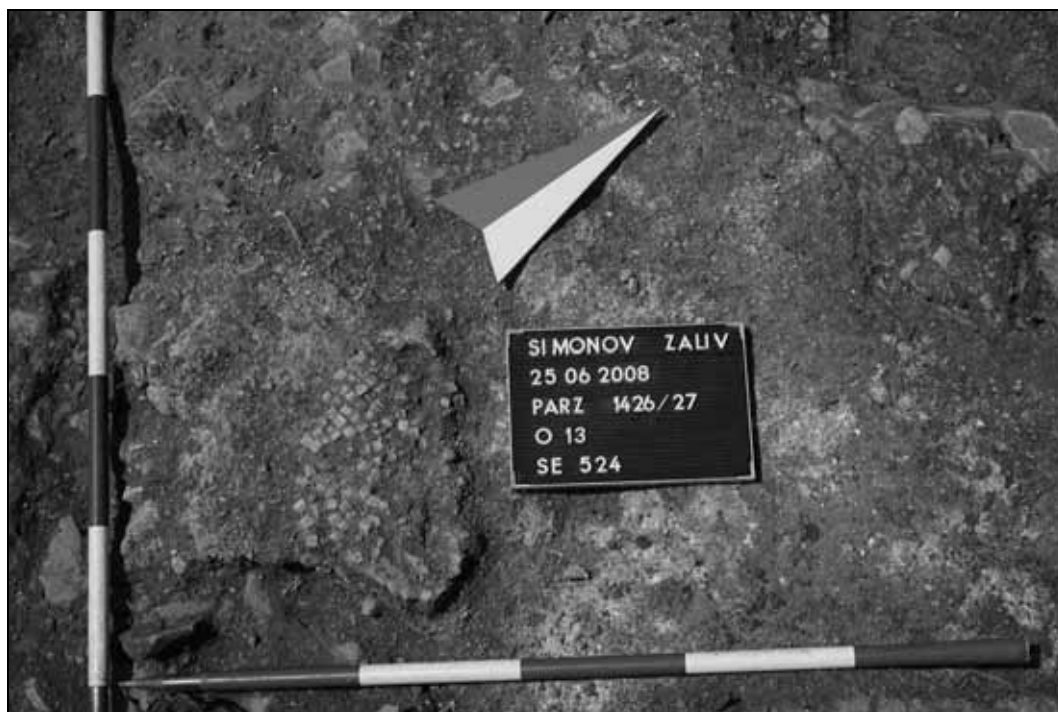
Abb. 6: Der Mosaikbodenrest SE 524 in Raum A (Periode 2). Blick von Osten. Sl. 6: Ostanke mozaika SE 524 v prostoru A (obdobje 2). Pogled z vzhoda.