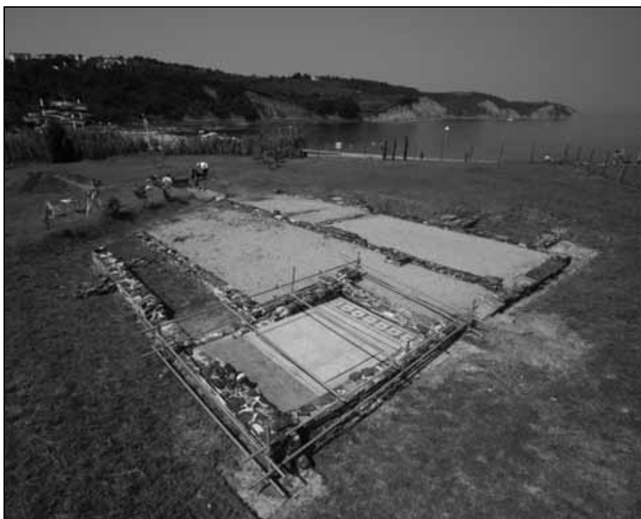
Abb. 3: Die ergrabenen, restaurierten Baureste im Mittelteil der Villa und die Grabung 2008 im Hintergrund. Blick von Nordosten.