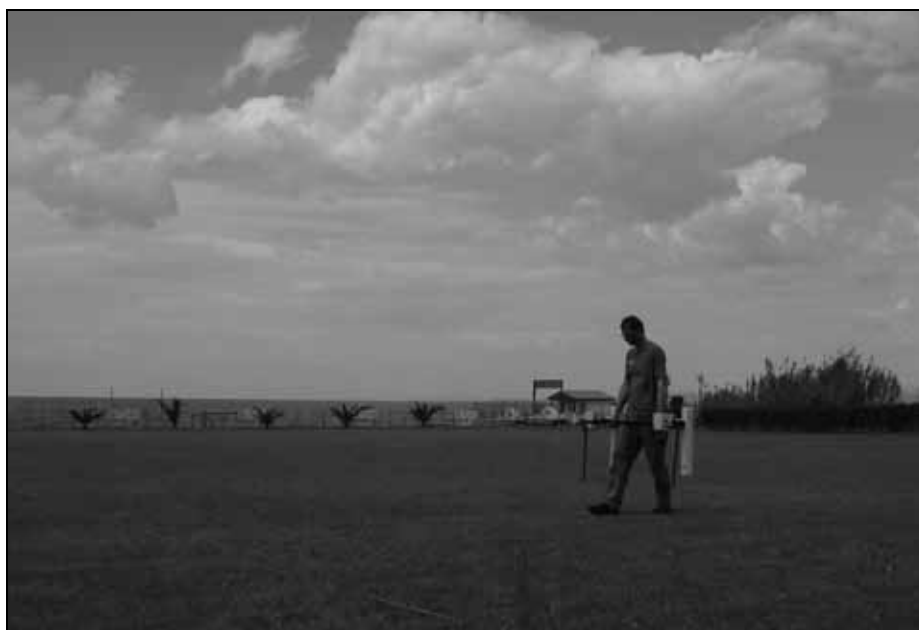
Abb. 2: Geophysikalische Prospektion mit Magnetik im Umfeld der Villa Maritima von San Simone/Simonov zaliv 2008.