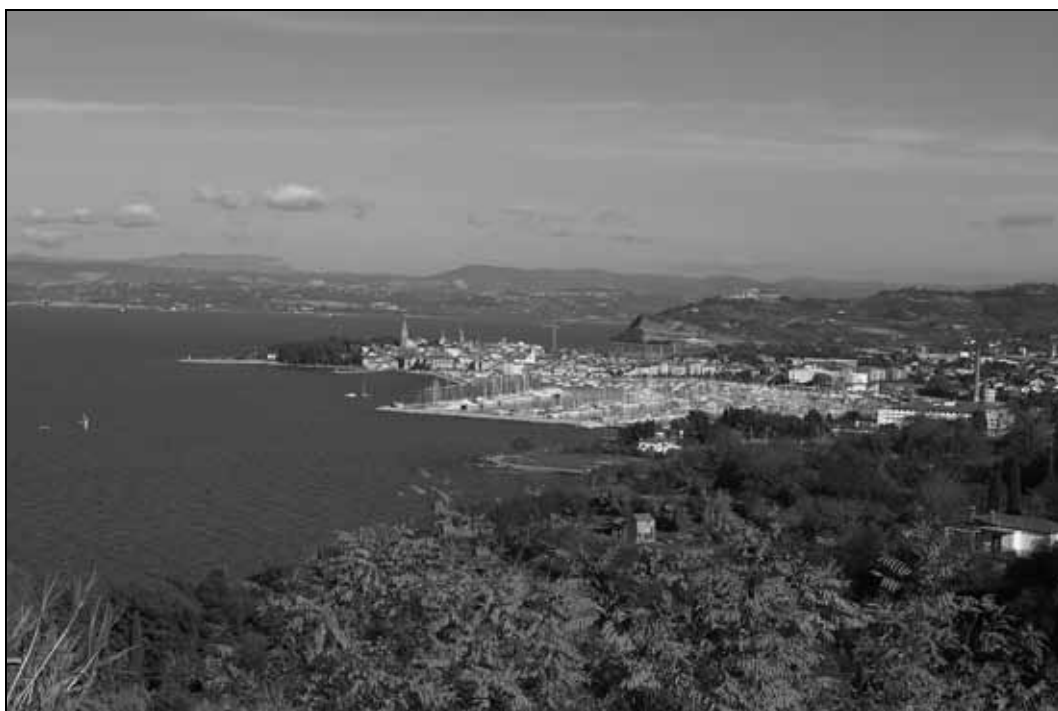
Abb. 1: Die Bucht von Isola/Izola mit der Villa von San Simone/Simonov zaliv. Blick von Südwesten.

Sl. 1: Izolski zaliv z vilo v Simonovem zalivu. Pogled z jugozahoda.