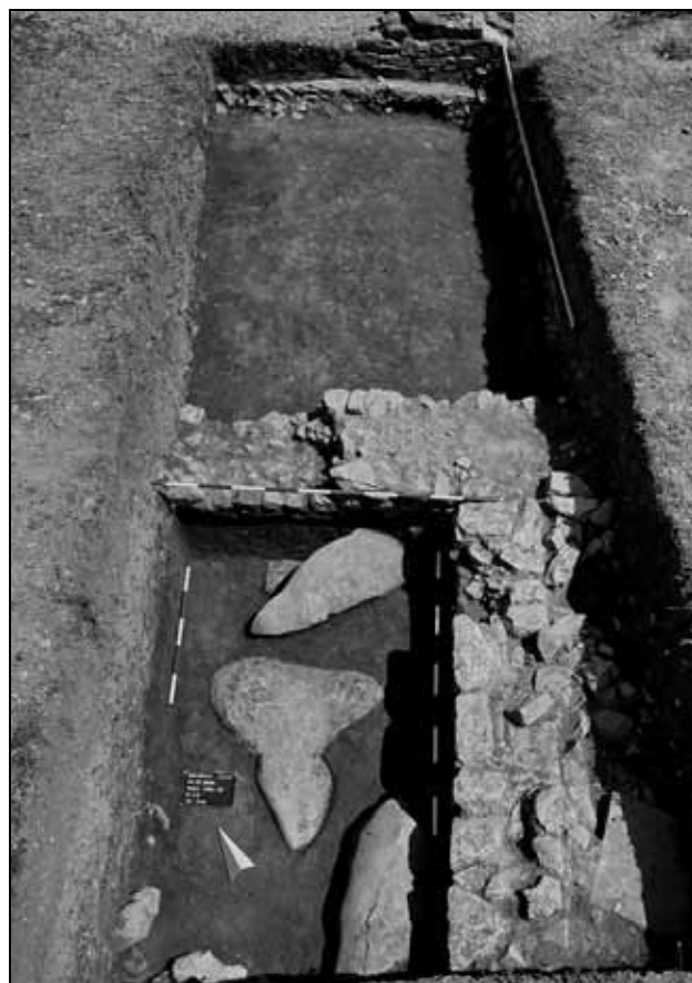
Abb. 4: Die unterste Planierschicht mit Kalksteinfindlingen der Periode 1.1 und die Mauern der Periode 2. Blick von Süden.

Die Planierungen sind auf der gesamten ergrabenen Fläche erkennbar, was auf eine großflächige erste Vorbereitungsphase zur Anlage der Villa schließen lässt. Die Arbeiten mit dem Ziel, den Küstenstreifen für die Bebauung mit einer großen Villenanlage aufzubereiten, waren sehr umfangreich, wobei eine Niveauerhöhung von mindestens 0,7 m erfolgt ist. Der Mauerbau beschränkt sich im ergrabenen Bereich auf drei Mauerzüge