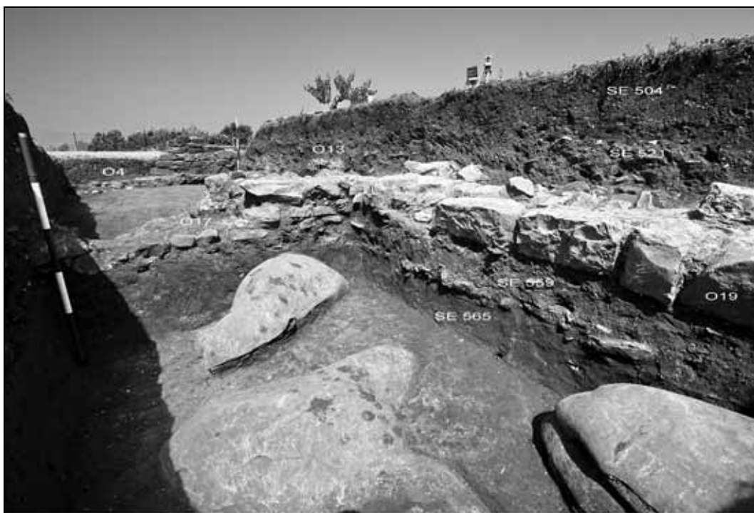
Abb. 7: Die Befunde der Grabung 2008: Im Vordergrund die Planierungen der Perioden 1.1 und 1.2 (SE 565, SE 559), im Mittelteil das ausgerissene Mauerfundament O17 und rechts die schräg ansetzende seichte Fundamentlage O19. Über den Mauern die Ausrissgrube SE 521 der Periode 3 und die Kulturschicht SE 504 aus Periode 4. Blick von Süden.

Die Funde aus diesem Aufgabeniveau datieren hauptsächlich bis zur Mitte des 1. Jahrhunderts n. Chr., beispielsweise die Terra Sigillata-Schalen Consp. 27, 29, 34 und 37. Der jüngste Fund repräsentiert eine Firmalampe, vermutlich des Typs Loeschcke Xa (Buchi, 1975, XXIX–XXXIII). Bemerkenswert ist das Fehlen der ab der zweiten Hälfte des 1. Jahrhunderts n. Chr. vermehrt an der oberen Adria belegten Eastern Sigillata im Fundspektrum des Grabungsschnitts 2008 (Cipriano, Sandrini, 2003; Žerjal, 2008, 132, fig. 1), auch ist bislang kein Nachweis von Feinware des Fabrikats E zu verzeichnen, die beispielsweise in Sermin in einem Kontext des 1. Jahrhunderts n. Chr. (Horvat, 1997, 110) häufig vorkommt.