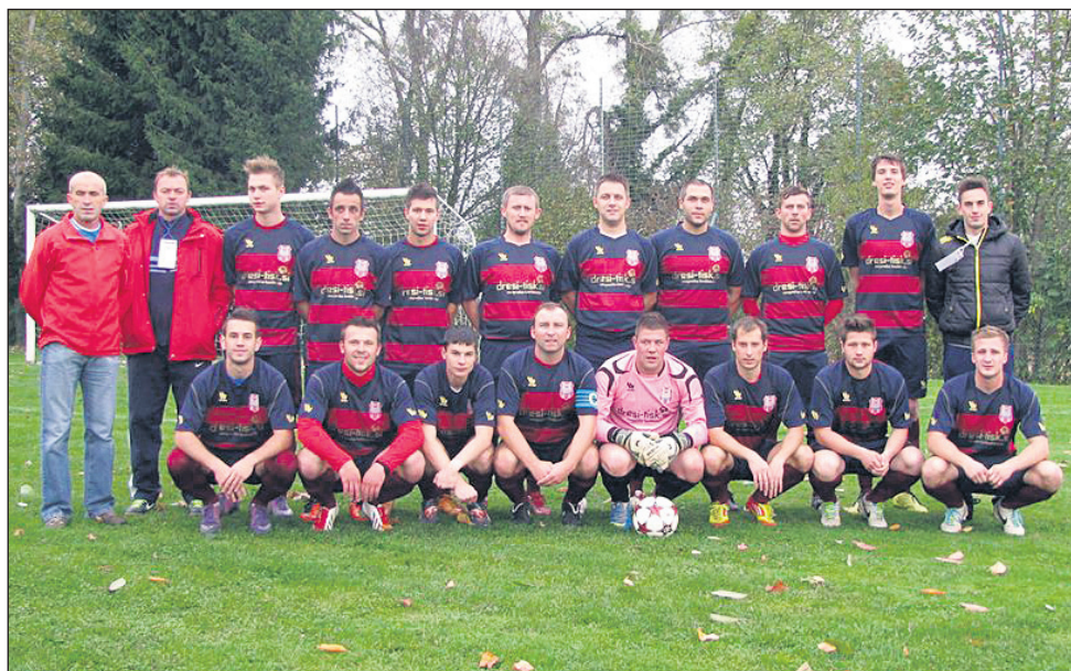
Članska ekipa ŠD Hajdoše