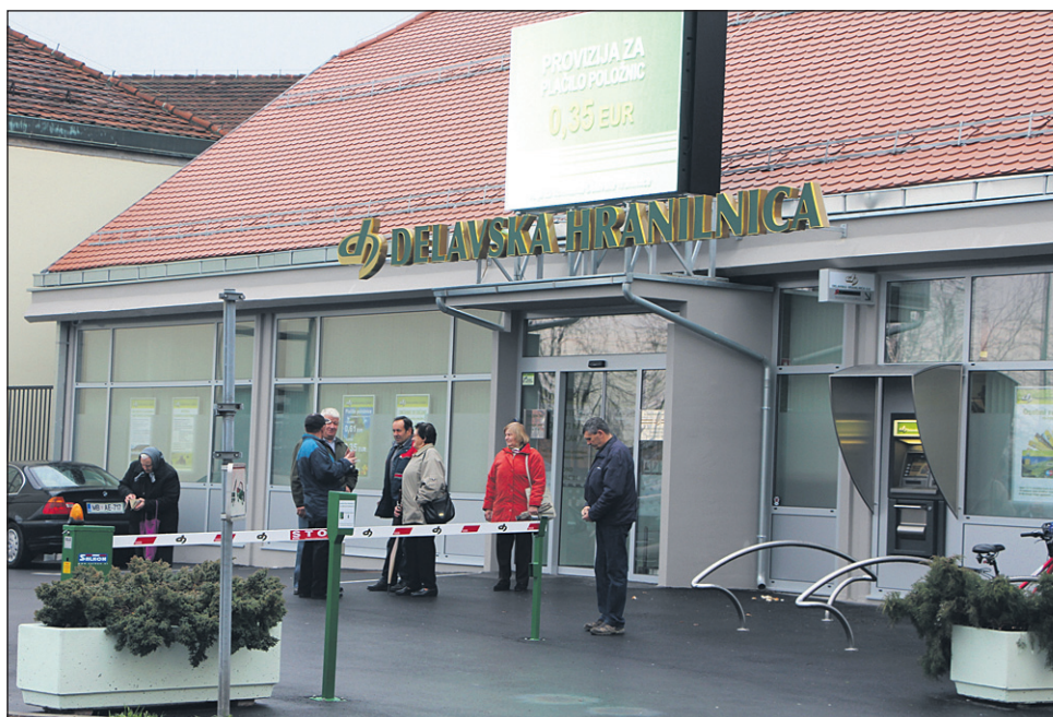
Z novimi poslovnimi prostori Delavske hranilnice so pridobili tako zaposleni kot stranke.