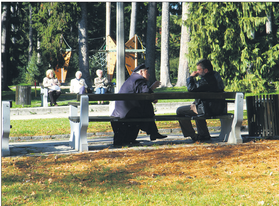
Življenje upokojencev postaja resnično vse težje in nevzdržno, posebej za okoli 300.000 tistih, ki imajo dohodke pod 622 evrov.

šemu sloju ljudi. Rešitev je le uvedba kriznega davka, ki bi bil pravičnejši za vse. Polance vprašujemo, zakaj so bili za ukinitve državnih pokojnin, saj so s tem povzročili nove izbrisane, ki so brez pravic in prihodkov. Zakaj so ukiniteli varstveni dodatek k pokojninam? Če imaš prihranjenih le nekaj sto evrov za svoj pogreb, ostaneš brez varstvenega dodatka, to je nesmiselno in škodljivo, tako kot je nesmiseln odvzem dela pokojnine zaradi varčevalnega zakona, saj vrnitev ni pravična. Nesmiseln je tudi odvzem lastnine za prejeto socialo, zato mnogi raje živijo v hudi bedi in stiski, kot pa da bi prejeli tistih nekaj evrov resnično potrebne socialne pomoči. Ukinja se celo pogrebna in posmrtnina. Ali bomo reveže spet pokopavali za pokopališkim zidom, njihova trupla pa zavijali v rjuhe? Takšne krivice in nered v državi najhujše