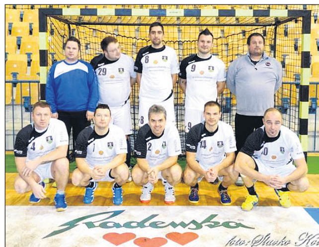
Ekipa RK Jeruzalem Ormož, ki je nastopila v Celju