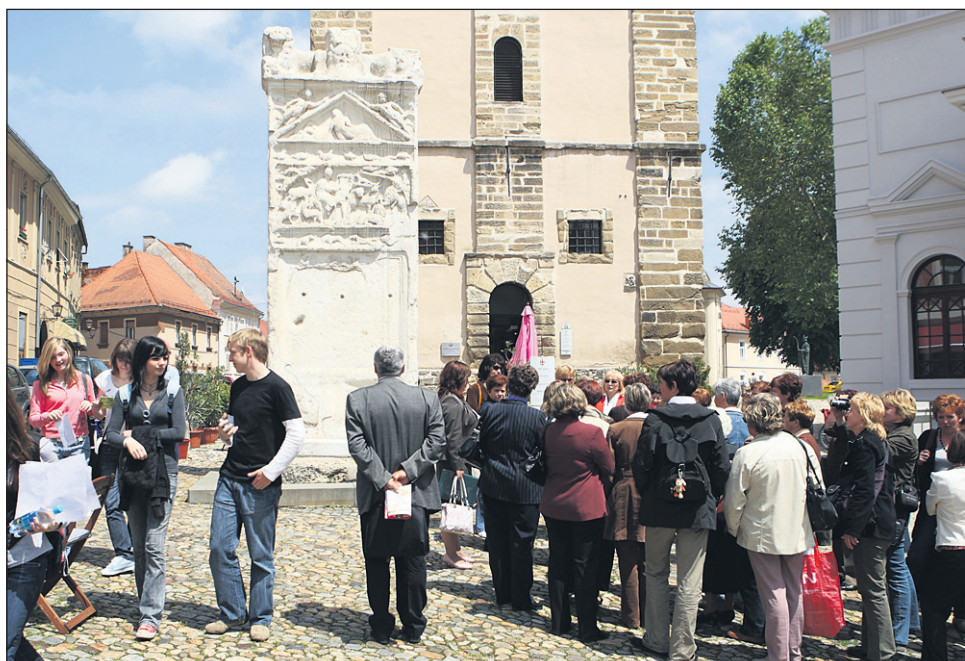
Slovenski turizem letno prispeva v BDP države 12 odstotkov.

Na sestanku slovenskega turističnega gospodarstva z vsemi svojimi organiziranimi institucijami, ki je bil 9. januarja letos, so ugotovili, da kljub izrecni obljubi predsednice Vlade RS Alenke Bratušek na Dnevh slovenskega turizma, 6. oktobra lani, STO še ni začela ponovno delovati kot samostojna institucija. Pripravljena sprememba zakona namreč še vedno ni bila obravnavana v Državnem zboru. Po izjavi predsednice vlade, ki jo je dala 8. januarja letos, pa se sedaj čaka na novega gospodarskega ministra. Z vsakim dnem zamude, ki nastaja, se turističnemu gospodarstvu dela velika škoda, ugotavljajo turistični delavci. Nacionalno turistično organizacijo imajo namreč vse države na svetu, razen dveh, saj je leta pogoj za konkurenčno partnersko sodelovanje na mednarodnem turističnem trgu v hudem boju za goste. Slovenija je z izgubo samostojne nacio-