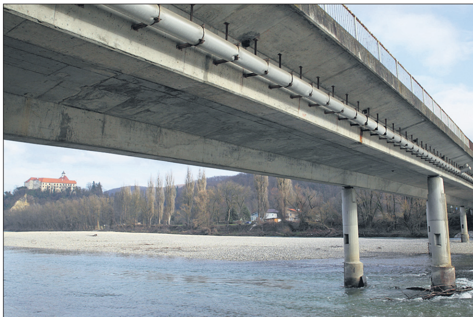
Most na Borlu je označen z oceno slabo.

Med premostitvene objekte med drugim uvrščamo mostove in nadvoze. Kot so sporočili iz DRSC, je poleg 15 premostitvenih objektov, za katere so omejitve prometa že objavili, v Sloveniji še 180 takšnih, za katere se lahko omejitve pričakuje v prihodnjih mesecih. »Preglede izvajajo posebne strokovno usposobljene organizacije. Pregledujejo se vsi dostopni deli objekta, ki se ovrednotijo, nato se poda oceno stanja objekta od ena do pet. Statični preračuni, na podlagi katerih se odredijo morebitni ukrepi omejitve skupne dovoljene mase, se izvajajo v odvisnosti od ugotovitev pregledov. Trenutno se opravljajo statični preračuni na poleg že znanih 15 objektov še na desetih objektih. Morebitni ukrepi za omejitve bodo znani v maju 2014. Pri