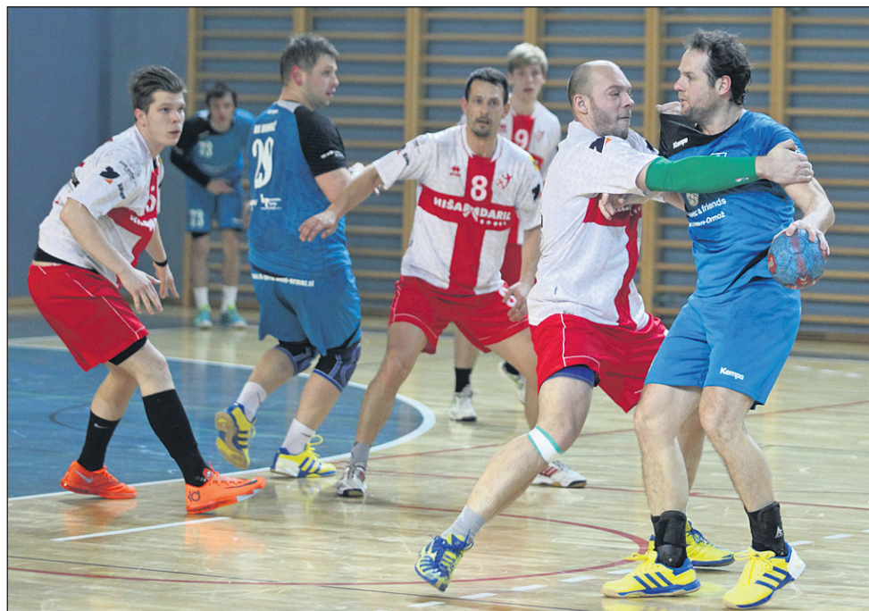
Rokometaši Drave (1. B SRL) so se po najboljših močeh upirali 1. A-ligašu iz Ormoža.