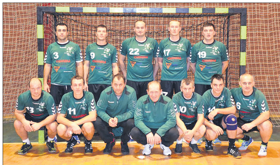
Veterani Velike Nedelje

Ptujске veteranke bodo 15. 2. gostiteljice turnirja, ki spada med najboljše v veteranski konkurenci v državi. Veterani Velike Nedelje bodo na tem turnirju branili osvojena naslova iz zadnjih dveh let.