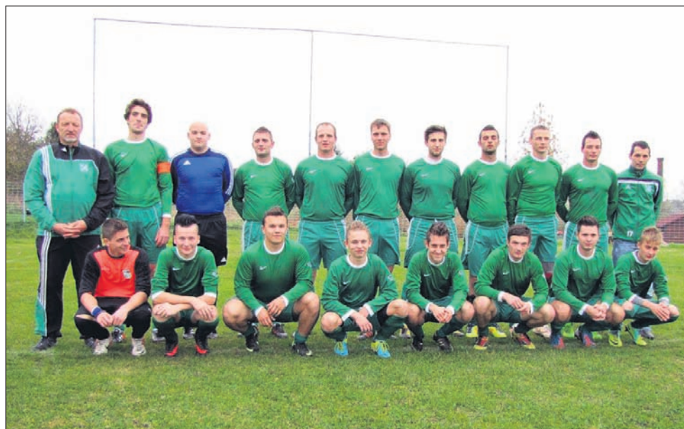
Članska ekipa NK Rogoznica