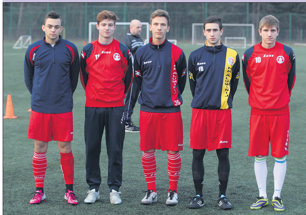
Mlade moči Aluminija: mladinci, ki so se pridružili članski ekipi na pripravah