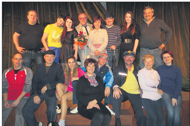
Člani gledališke sekcije KD Franceta Prešerna obljublajo uro in pol smeha ter zabave.