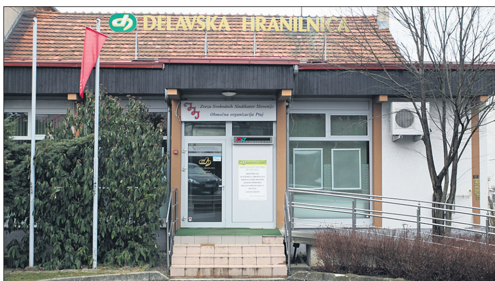
Poslojpe na Čučkovi ulici na Ptujju je v lasti ZSSS OO Spodnje Podravje.