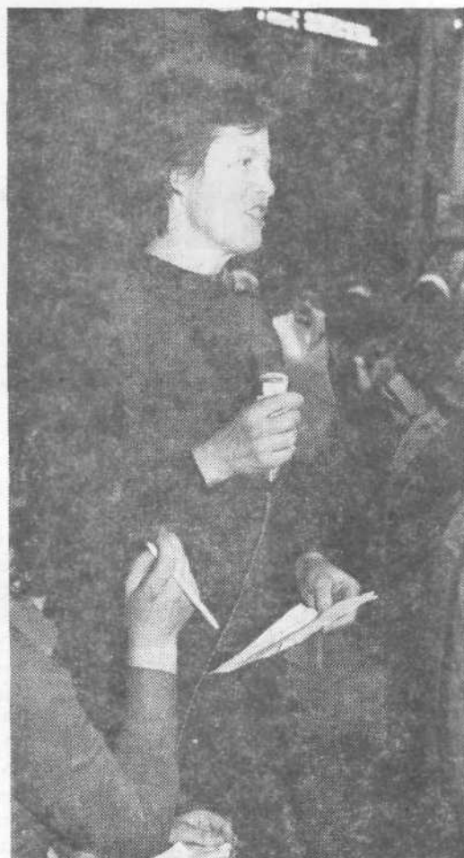
Mikrofon je bil za dve uri njihov ...

● »Nekateri menijo, da bi bilo dovolj, če bi bila ženska enakopravna moškemu v pravicah. Res je, tudi tukaj treba spremeniti nekaj zakonov. Toda mi smatramo, da je vse skupaj treba postaviti malo drugače. Ne gre za to, da so moški ženske odriivali. Vemo, kdo je kriv neenakopravnega odnosa do žensk, pa tudi večine moških v svetu. Saj ne umirajo od lakote samo ženske, saj v vojni ne umirajo le ženske. Kapitalizem, se pravi razredno izkoriščanje, je v globini tega, kar danes imenujemo diskriminacijo žensk. Ne borimo se torej samo za enakopravnost v današnjih pogojih. Postavljamo vprašanje, s kom smo enakopravne? Ali naj bo črnka enakopravna