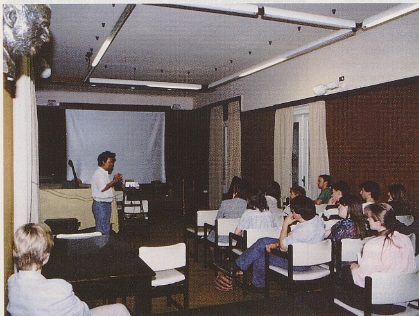
Predavatelj z Madagaskarja v klubu.