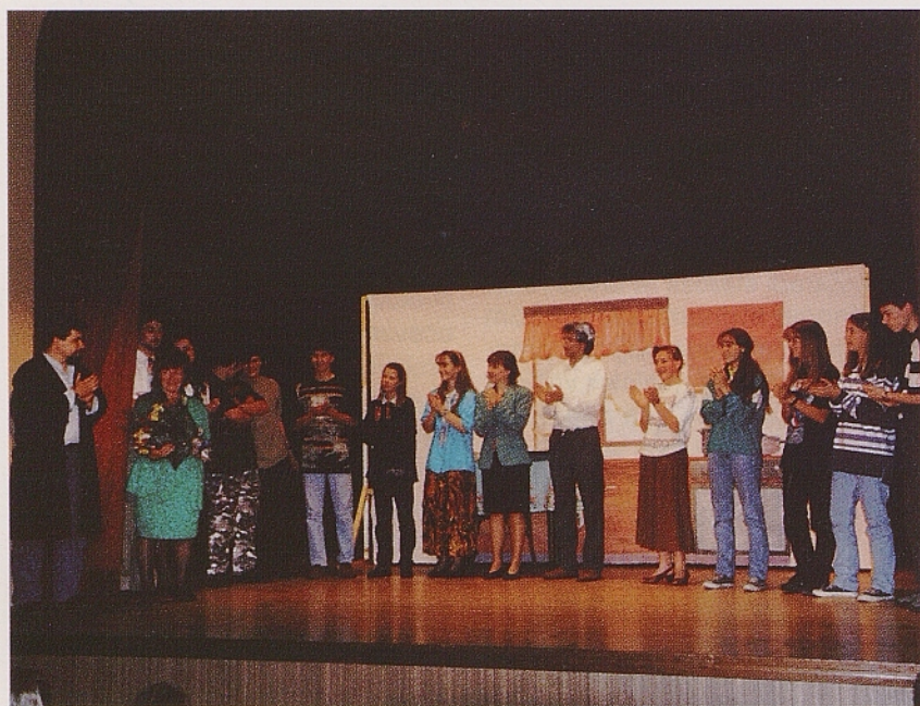
Člani tajnega društva PGC v razredu na rojanskem odru.