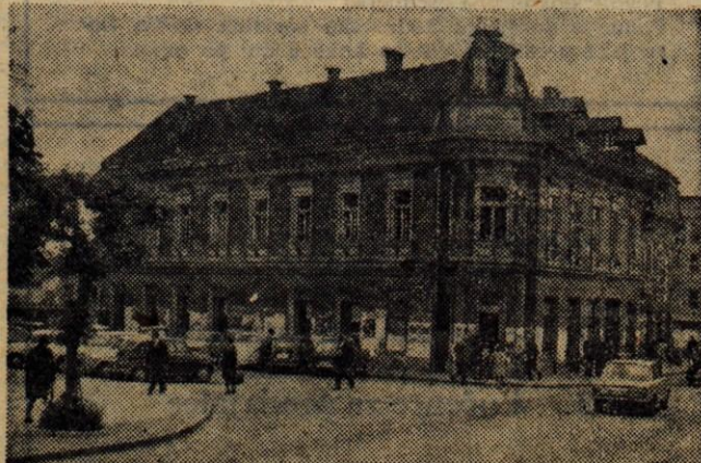
V tej stavbi (Kranj, Koroška c. št. 8) je obratovala tiskarna (z Reševu koncesijo) od l. 1912 do jeseni l. 1969. Sprva se je imenovala Tiskarna Sava (do l. 1947), potem Gorenjska tiskarna (do l. 1955) in končno tiskarna ČZP Gorenjski tisk.