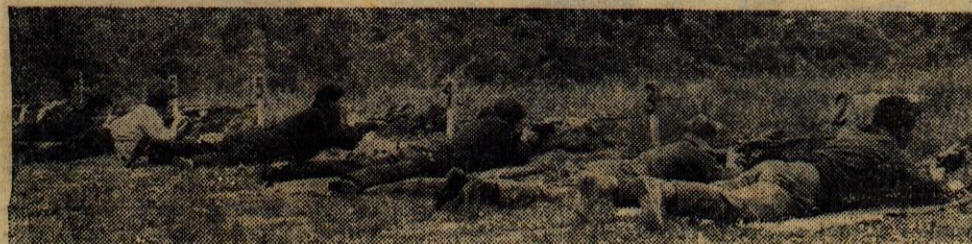
V preteklih dneh so bile v Kranju vaje, na katerih so sodelovale teritorialne enote. Sestavni del vaj je bilo tudi streljanje.