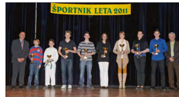
Pokale so razdelili tudi posameznikom z izstopajočimi rezultati na državnih prvenstvih, v evropskem pokalu in na evropskih prvenstvih.