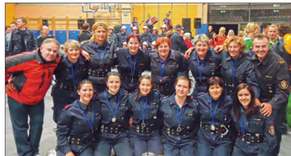
Obe hajdoški gasilski enoti v družbi mentorjev po izjemnem uspehu na zaključnem pokalnem tekmovanju v spajanju sesalnega voda za leto 2012.

24. marca je v športni dvorani v Horjulu v organizaciji PGD Žažar potekalo zaključno pokalno tekmovanje v spajanju sesalnega voda za leto 2012, ki je bilo eno izmed šestih letošnjih tekmovanj v sezoni. Zvrstila so se v Staršah, Keblju, Zalogu pri Cerkljah, Novi Cerkvi, Šentjurju in zaključno v Žažarju.