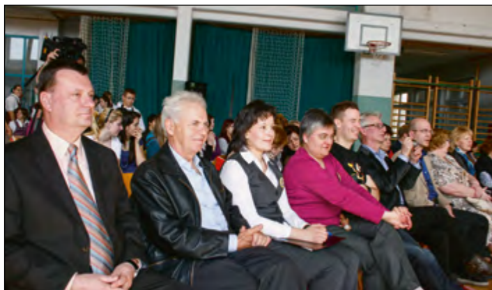
Drugi dan je bila na šoli »evropsko« obarvana prireditev; najprej kratek program, ki ga je pripravila šola, nato so se predstavile vse partnerske šole z izvirnim programom. V objektiv smo ujeli tudi nekatere domače in tuje goste.