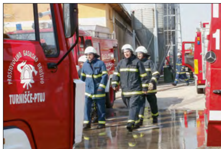
Pri gašenju so sodelovala številna gasilska društva.