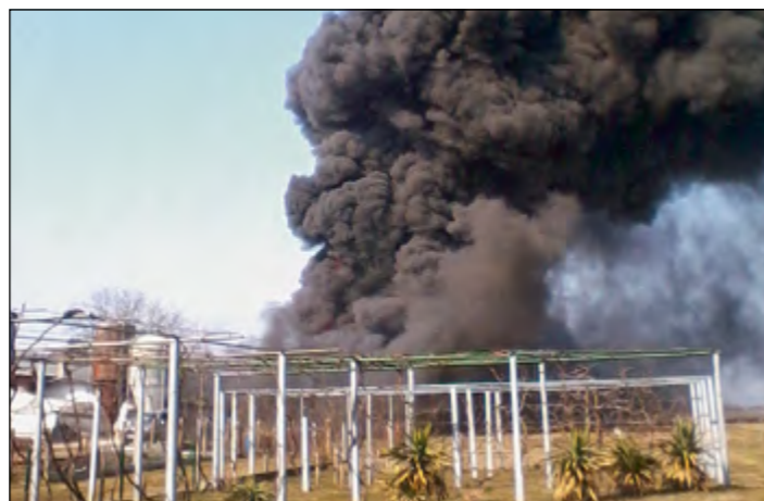
Gost črn dim se je videlo daleč po okolici.