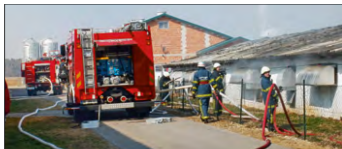
Požar na objektu pogašen, škoda ogromna.

Člani ŠD Skorba se v tem letu lahko veselijo tudi nove pridobitve ob obstoječi športni zgradbi, kjer je tudi sedež društva. Načrtov v letu 2012 jim ne manjka, v ospredju pa bo zagotovo nogomet in čim boljša igra domače izbrane nogometne vrste.