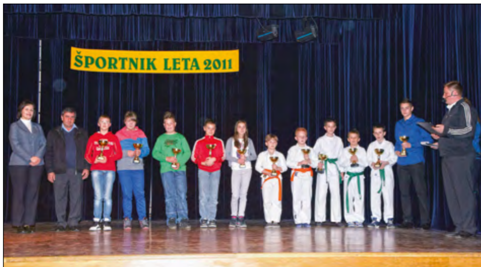
Najboljši v šolskem športu na medobčinskem, področnem in državnem tekmovanju osnovnih šol

Športna zveza Občine Hajdina je v ponedeljek, 19. marca, v domu krajanov v Skorbi uspešno organizirala tradicionalno prireditev Športnik leta občine Hajdina 2011.