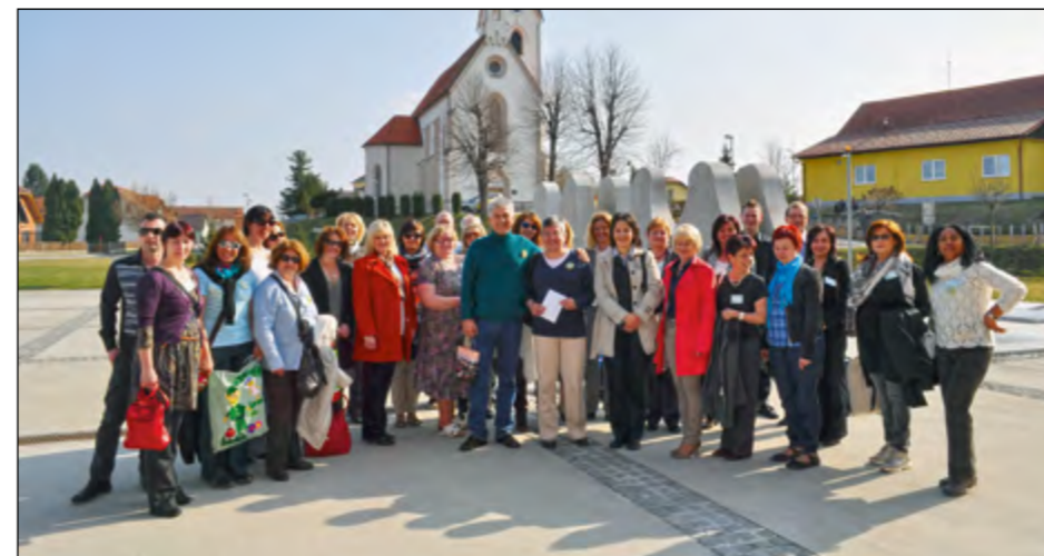
Gostje iz osmih evropskih držav so si ogledali tudi sedež občine Hajdina, obiskali Martinovo cerkev in klet, bili pa so tudi pri 1. mitreju.

Na Osnovni šoli Hajdina se trudimo biti dobra šola in to prav gotovo dokazujejo uspehi naših učencev na različnih tekmovanjih, vključevanje v različne projekte in uspešno sodelovanje z lokalno skupnostjo.