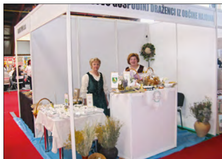
Med 117 razstavljalci na sejmu Altermed v Celju so Draženčanke predstavile svoja zelišča in izdelke iz zelišč. To je bila odlična promocija za društvo in občino.