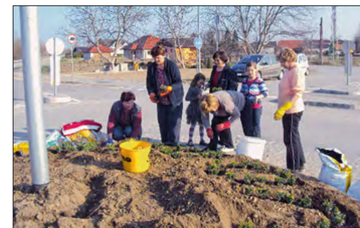
Še zadnji popravki in krožišče že ima novo, polepšano podobo.