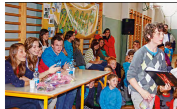
Ob uradnem zaključku projektov so na šoli pripravili prireditev X-faktor Hajdine. Posebej zanimiva je bila strokovna komisija.