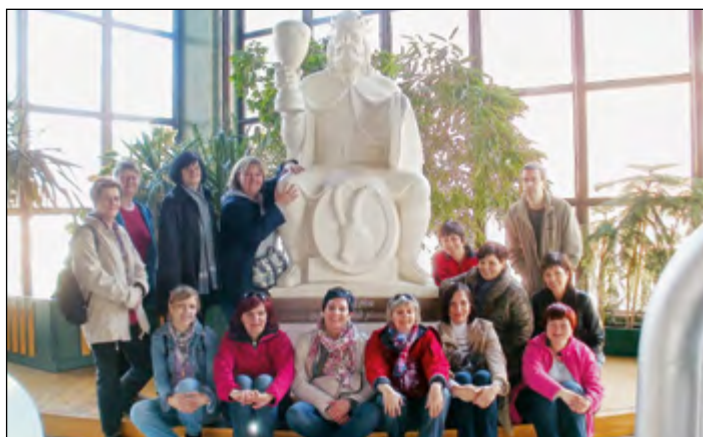
Skupinica izletnic z vodičem »v naročju« kralja pivovarjev Gambrinusa. V pivovarni so se poučile o sestavinah, mešanju, varjenju, zorenju in polnjenju »ječmenove župe«.