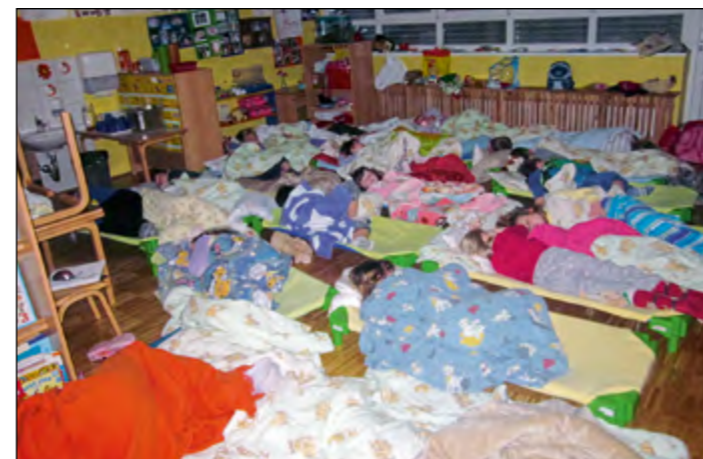
In tako smo zaspali ...

Ob svetovnem dnevu knjige za otroke se je porodila ideja, da bi v vrtcu izpeljali nočitev s pravljicami. Na roditeljskem sestanku sva idejo predstavili staršem. Strinjali so se in nama zaupali prav vse otroke.