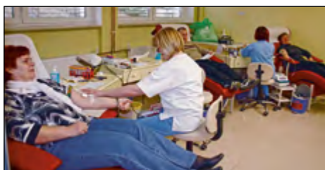
Naši hajdinski krvodajalci, na katere smo lahko zelo, zelo ponosni ...

Naša kri je nenadomestljivo zdravilo in najdragocenejše, kar lahko podarimo. Te besede je bilo slišati tudi v začetku marca na prvi krvodajalski akciji, ki jo je organizirala občinska organizacija Rdečega križa (RK) Hajdina, potem ko je ta znova začela humanitarno delo. Odziv je bil presenetljivo zelo dober in na ptujskem oddelku za transfuziologijo se je zbralo veliko znanih obrazov iz občine Hajdina, ki so prišli darovat kri in s tem pomagat tistim, ki zelo potrebujejo to življenjsko tekočino.