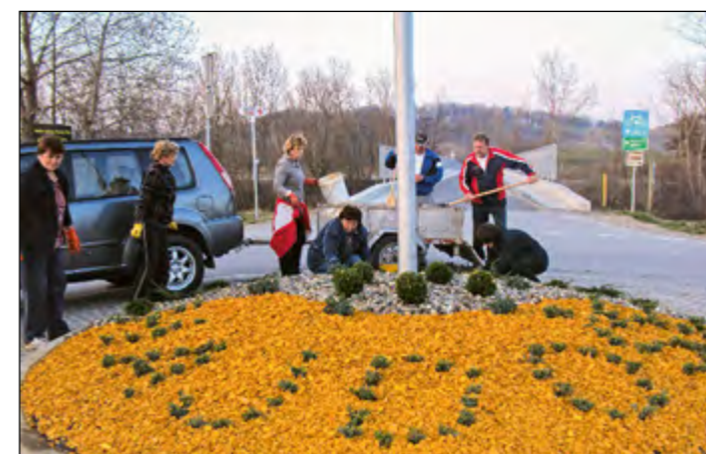
Zasajanje grmičkov v obliki napisa Hajdoše