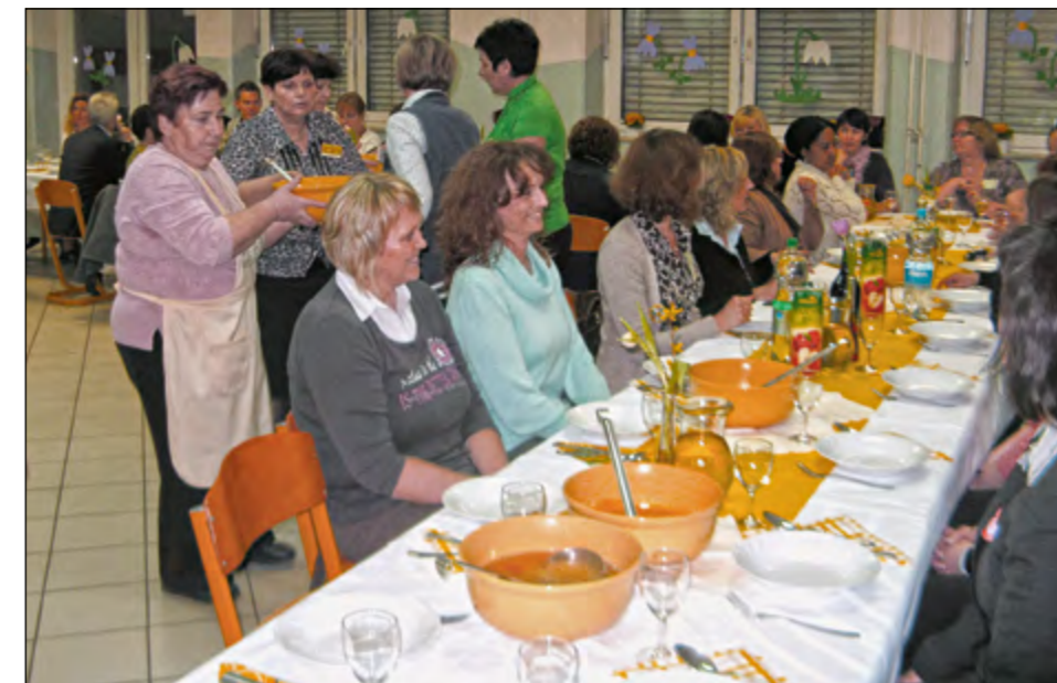
Posebej zanimivo pa je bilo pri mizah, kjer so jedi gostom zelo teknille.