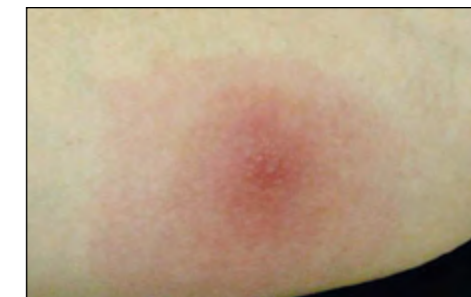
Vnetje po piku insekta

Alergija je pretiran in neprimeren imunski odziv na sicer neškodljive snovi. Snovi, ki sprožijo alergijsko reakcijo, imenujemo alergeni. Alergene lahko v organizem vnesemo skozi dihala, lahko jih zaužijemo ali pa pride do reakcije po neposrednem stiku kože z alergenom. Pri občutljivi osebi alergeni takoj po vnosu sprožijo alergijsko reakcijo.