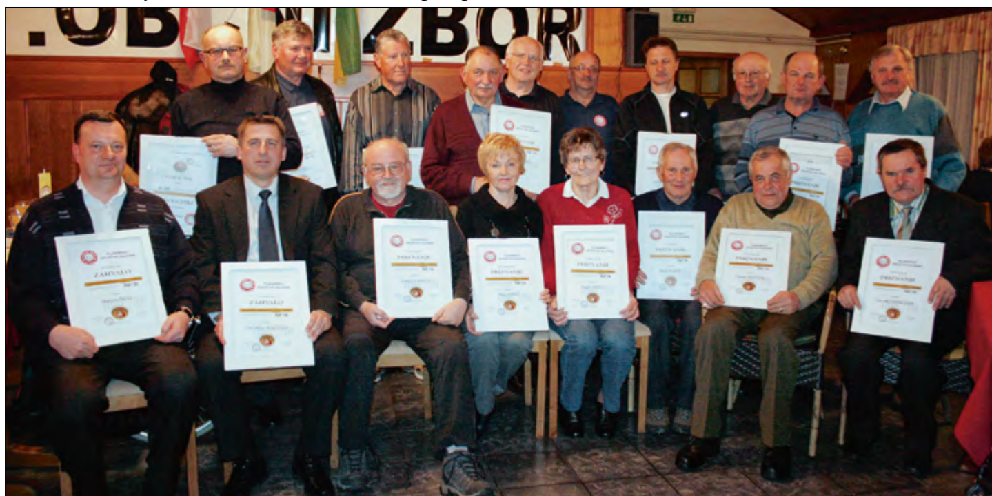
Na 11. občnem zboru so hajdinski planinci podelili posebna priznanja, tudi v znak zahvale za dobro in uspešno sodelovanje.