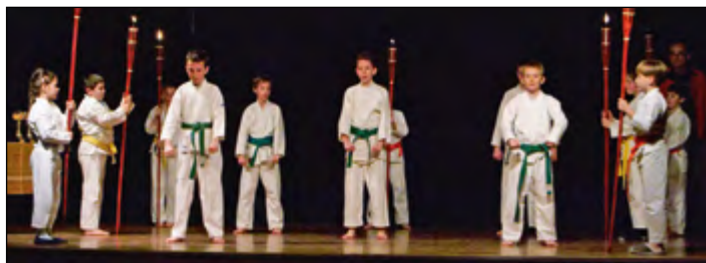
Med nastopajočimi so bili tudi mladi iz karate kluba WKSA Hajdina.