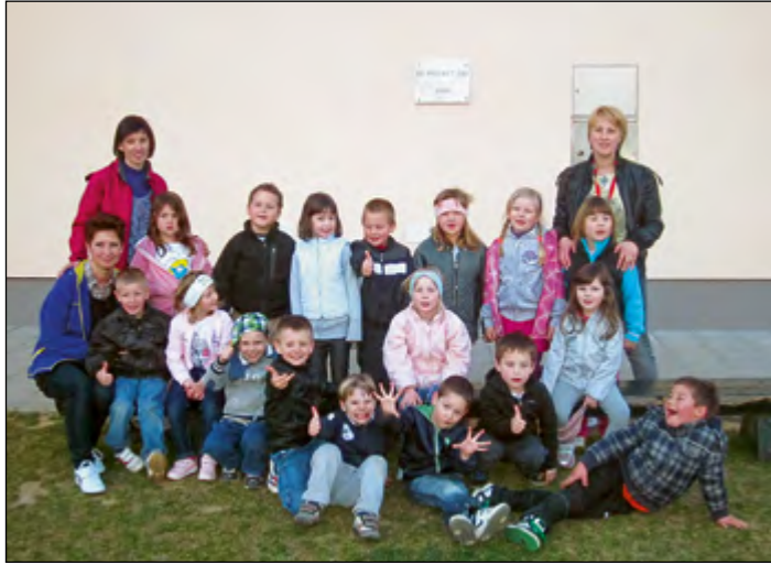
Vsi, ki smo prenočili v vrtcu.

In kako je vse skupaj potekalo? Otroke sva seznanili z nočitvijo v vrtcu. Njihov odziv je bil presenetljiv. Vsi so si želeli prespati tukaj. 23. marec je bil dan, ko smo v vrtcu res prenočili. Starši so otroke pripeljali že zjutraj. Ob petkih imamo igralni dan, zato smo se veliko igrali, pogovarjali, plesali in peli, udeležili pa smo se tudi čistilne akcije Očistimo Slovenijo v enem dnevu.