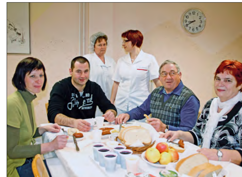
Po odvzemu krvi je bilo prijetno posedeti še v posebni jedilnici, kjer je vsakega krvodajalca čakalo tudi okrepičilo.

Učenci OŠ Hajdina, ki so na tekmovanju Turizmu pomaga lastna glava z Učno-kolesarsko potjo osvojili srebrno priznanje, so si s tem prislužili tudi darilo župana Občine Hajdina. Z Leksikonom turizma, najnovejšo knjižno zakladnico znanja s tega področja, bo občinska uprava obogatila šolsko knjižnico in s tem pomagala učencem in učiteljem, da bodo vedno imeli pri roki izjemen učni pripomoček, ki jim bo na voljo pri njihovem turističnem opismenjevanju.