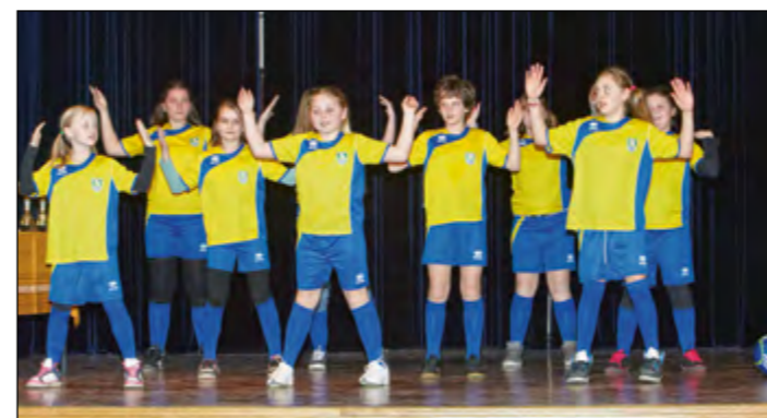
Z veliko energije se je predstavila tudi navijaška skupina ONŠ Golgeter Hajdina.