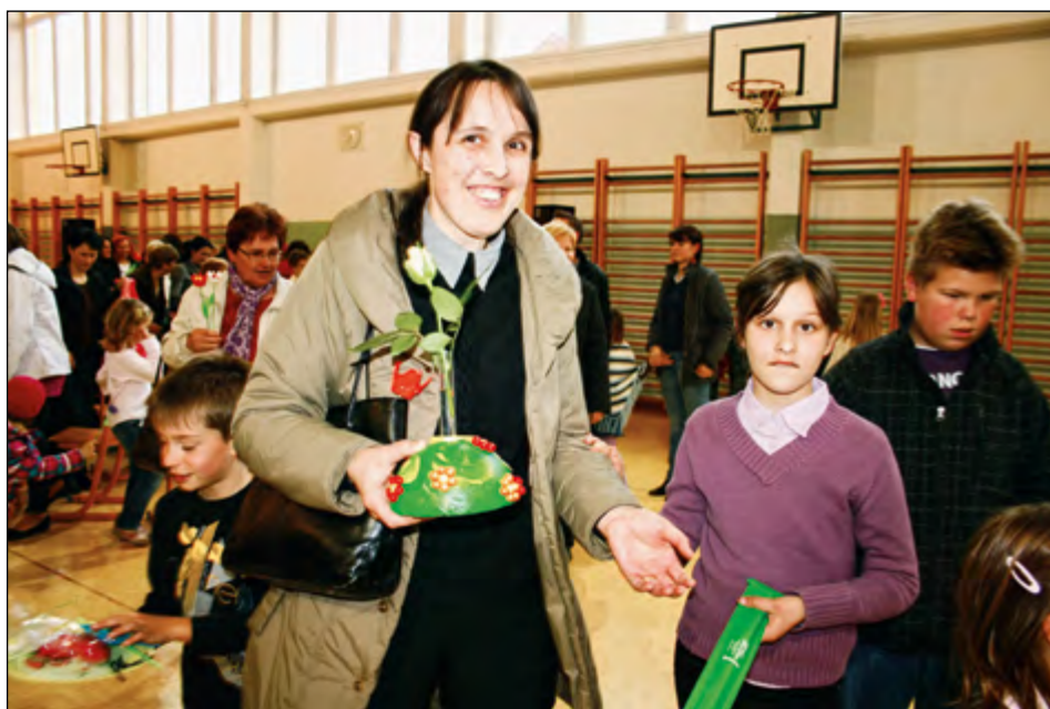
Rožice za mamice ...

Mojih bralnih užitkov je veliko. Branje me pomirja in iz knjig se veliko naučim. Rada berem zanimive knjige, predvsem pa jih veliko preberem o živalih. Berem popoldan, včasih pa tudi preden grem spat. Zgodbe, ki jih berem, so navadno zanimive, konec pa srečen. Rada pišem zgodbe, ki so povezane z vsebino, ki sem jo prebrala. Knjige rada berem tudi zato, ker me popeljejo v svet domišljije in nimam strašnih sanj. Če ne bi bilo knjig, ne vem, kako bi potem preživljala popoldneve.