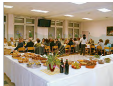
Bogato obložena miza je ponujala jedi, značilne za naše kraje, in gostje so mnoge z veseljem poskusili.

Članice vseh štirih ženskih društev občine Hajdina so se odzvale vabilu osnovne šole Hajdina, da prispevajo svoj delež pri pogostitvi udeležencev v okviru evropskega projekta Comenius. Za ta namen so v četrtek, 22. marca, pripravile večerjo za vseh 25 gostov in gostiteljev v jedilnici osnovne šole.