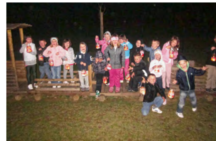
Pohod z laternami