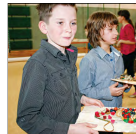
Darilca za mamice so nastala že v razredu. Izdelali so jih učenci in na koncu podarili svojim mamam.