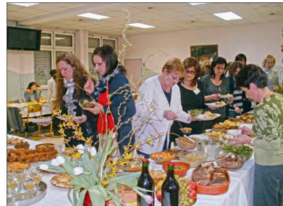
Članice vseh štirih ženskih društev občine Hajdina so s kulinarčno pestrostjo in številnimi dobrotami veliko pomagale pri pogostitvi gostov iz osmih držav in različnih šol, ki so tako kot OŠ Hajdina vključene v mednarodni projekt Comenius.