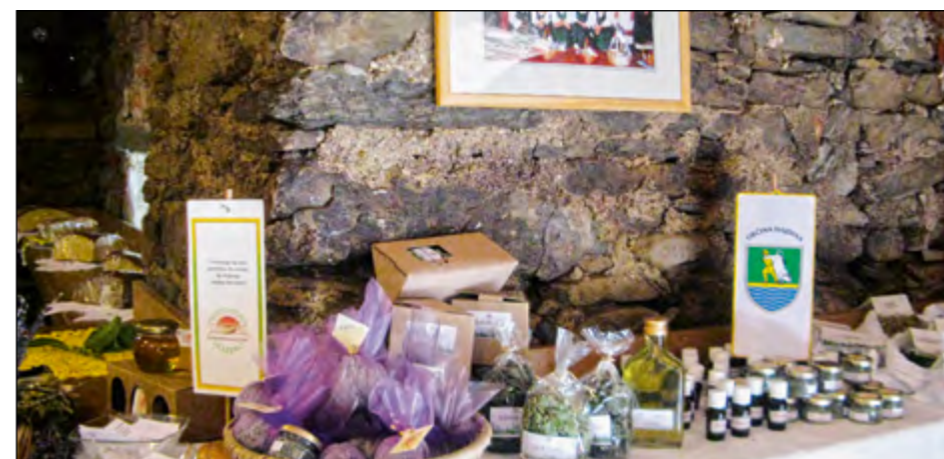
Razstavo krušnih dobrot v Vidovi kleti v Vidmu so Draženčanke obogatile z dišečimi zelišči.