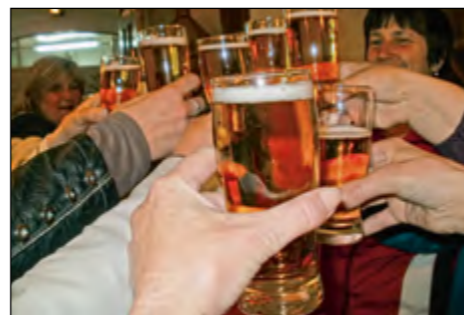
Želja po pivu je na poti domov postala neobvladljiva.

Na Aškerčevini, kamor pozimi sonce sploh ne posije, da razen »grabnavlerja« (beri šmarnica) ne raste nobena druga trta, da pa poleg Aškerčeve do-