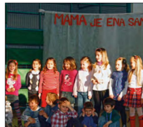
Mamicam so se ob materinskem dnevu predstavili tudi prvošolčki.