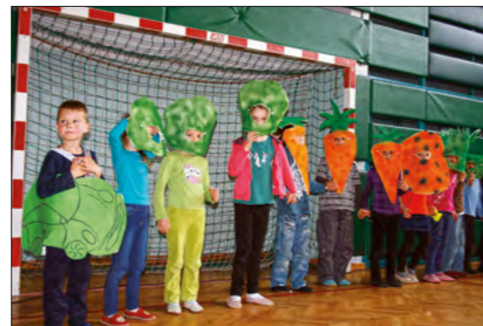
Prvošolci so se z žogo dobro znašli v prometu ...

izdelali preprost zemljevid za otroke, spoznavali smo zgodovino in prihodnost prometa, iskali smo povezave v literaturi, na internetu ter raziskovali vpliv prometa na zdravje in okolje.