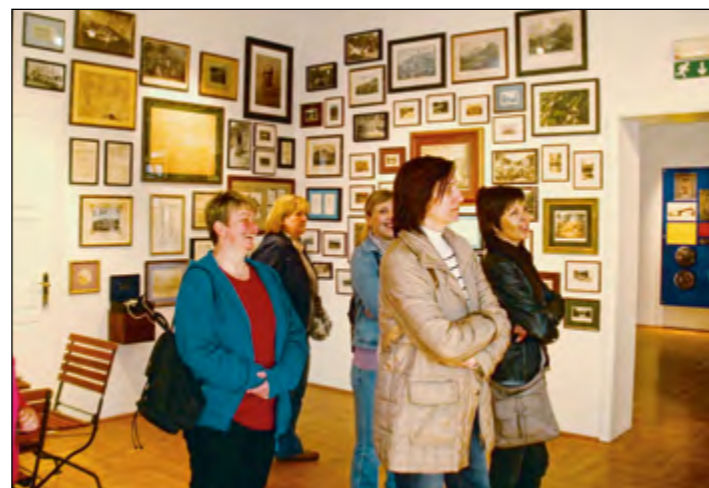
V Aškerčevi izbi so slišale veliko zanimivega.