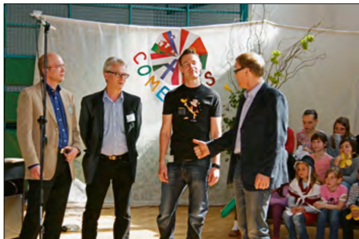
Nekateri so pri predstavitvi svoje države in šole še posebej izstopali ...

Namen projekta je, da bodo učenci vseh šol, vključenih v projekt, ustvarili svoj gozdni vrt, zanj skrbeli, ga proučevali, pobirali izdelke in iz njih pripravljali jedi. Oblikovali bodo spletno stran projekta in izdali skupen naravoslovni slovar ter knjigo receptov. Ves čas bodo potekale video konference, predstavitve aktivnosti in izmenjave pisem, čestitk ... Učenci bodo tako še bolj spoznali projektno delo, se srečali z drugačnimi kulturami in običaji, komunicirali v angleščini in ne nazadnje promovirali svoje naravno in kulturno okolje. Na šoli sedaj komaj čakamo, da bomo lahko začeli z urejanjem vrta v bližini šole, saj pomlad že trka na vrata. Čakamo samo še na odgovor lokalne skupnosti, kje bomo vrt lahko postavili.