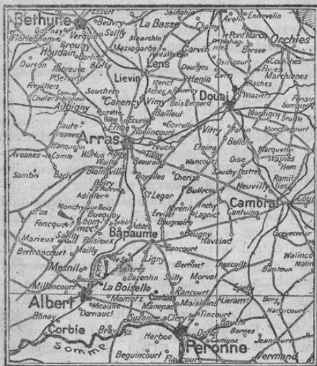
Zur englisch-französischen Offensive.

Z ozirom na uradna poročila nemškega generalnega štaba, ki jih objavljamo, prinašamo mali, a zanimivi zemljevid. Velika angleško-francoska ofenziva, ki je bila mnogo mesecev sem z neomejenimi sredstvi pripravljena, je pričela z naskokom v širokosti 40 kilometrov na obeh bregovih reke Somme