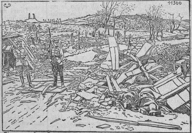
Eine von den Oesterreichern erstürmte russ. Feldstellung.

Zapadno bojišče. Dne 10. julija popoldne pričeti boji na obeh straneh Bapaume-Albert-Contalmaison in v gozdu od Mametza ter novi boji v gozdiču Trones in južno od njega se nadaljujejo s hudo ljutostjo. — Južno od Somme so Francozi pri nekem velikem napadu na fronti Belloy- Soyecourt doživeli občutljivi poraz. Napad se je v našem ognju popolnoma razbil; istotako obrnile so se slab- bejše sovražne sile proti La Maison- Barleux pod velikimi izgubami v njih izhodne postojanke nazaj. — Na raznih točkah fronte v Champanji, tako vzhodno in južno od Reimsa in severno-zapadno od Massiges, nadalje severno-zapadno od Flirey, bili so francoski napadi odbiti. — V pokrajini Maase odigrali so se na levi reke le manjši boji. Na desni reke potisnili smo svoje postojanke bližje na utrdbe od Souville in Laufee. Pri temu smo vjeli 39 oficirjev in 2106 mož. Močnejši protinapad