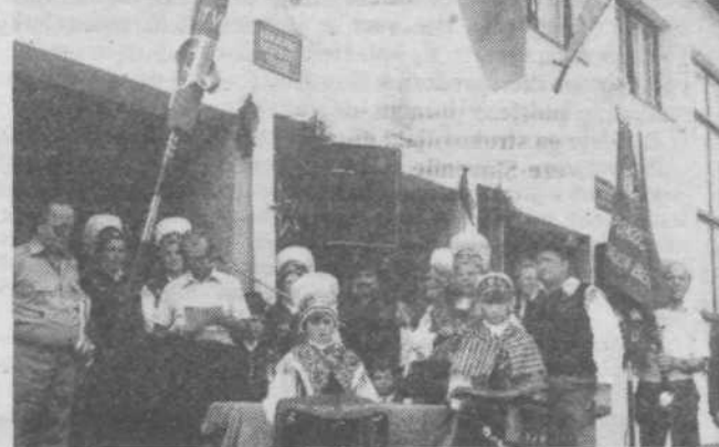
Pred slovesnim razvitjem novega prapora upokojencev v Dolskem