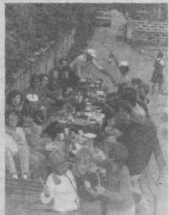
Prvi piknik — a ne poskusni!