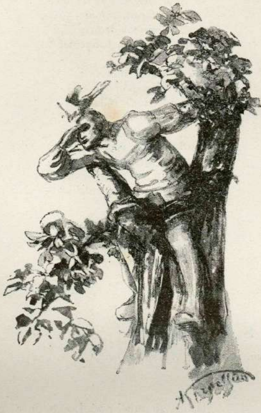
Zleze na visoko drevce.

Pravi Rávbarju Andréje: „Vôda sega že čez brêje; Mi ne móremo voziti, Vi v Ljubljáno pa ne priti.“