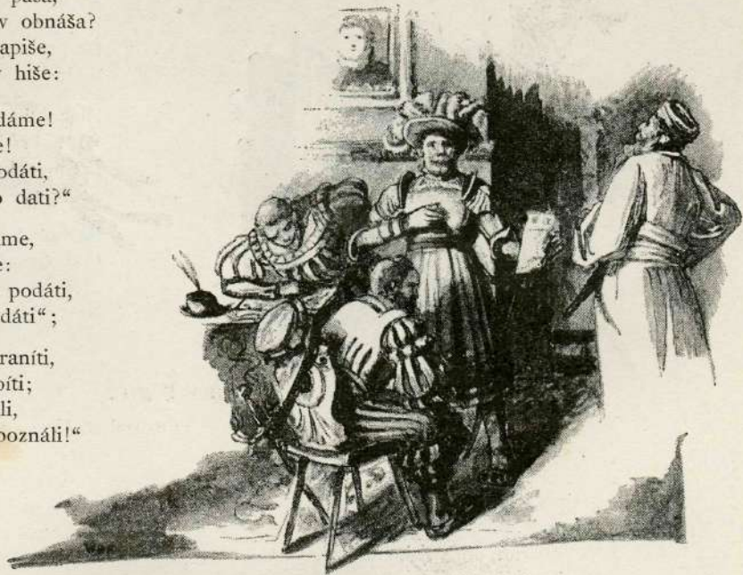
„Nočem z lépo se podati.“

„Turk če vzél nam Sisek bóde, Nam naróbe vse, vse pójde. — Mest' Ljubljána bo pokrájna, Kranjska dežéla túrška drájna.“