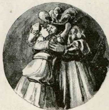
„Dve nedelji bodi zdrava!“

So brodniki še vsi spáli, Zavolj vód se vozit' báli, Sáve vel'ke, prederóče, Čez bregóve nastop'jóče.