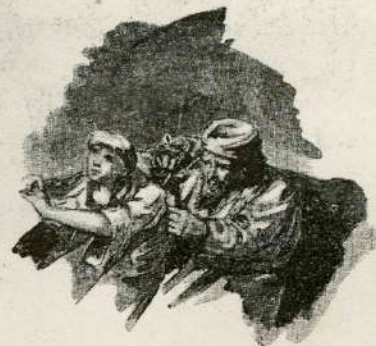
. . . list napiše.

So tako mu naredili, Préko Kópe se spustili, Pa pod Sisek se nabráli, Tam se v rove zakopáli.