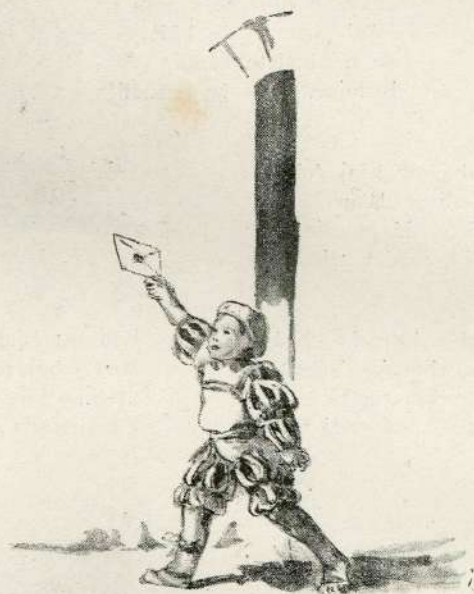
... Zagléda v ravnem pólji mlad'ga poba ...

Ravbar klicati brodníke Pod Črnučami vozníke: „Le na nóge, le vstaníte, Nas prék Save predrožíte!“