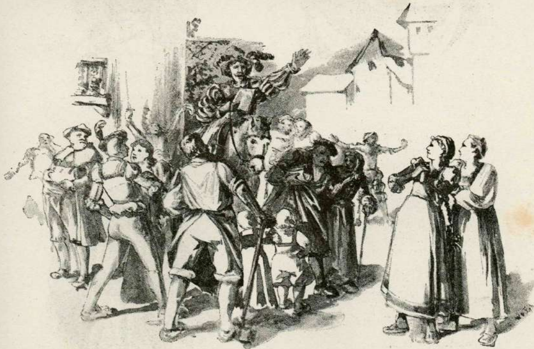
„Brž na vojsko napravljajte!“