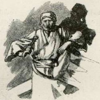
Gromëč boben nôsi v roci.

To si vóli túrški páša, Ki se Túrkom prav obnáša, Kak' bi vójsko vkupaj správil, Da bi Sisek pod-se zgrábil.