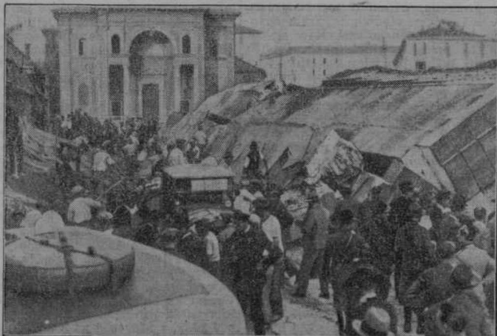
V italijanskem mestu Milano se je zrušil prehod preko železnice. Izpod razvalin so izvlekli mnogo mrtvih ter ranjenih.