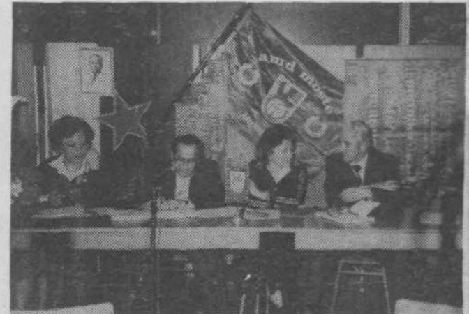
Delovno predsedstvo IX. skupščine AMD Moste.