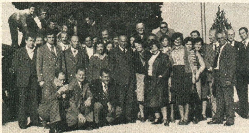
S srečanja krvodajalcev v zamejstvu