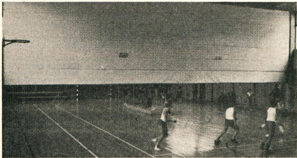
Ena izmed telovadnic, ki jo je opremil ELAN. S pregradno steno je mogoče pridobiti prostor za vadbo večih skupin hkrati. Pregrada zagotavlja vidno in zvočno izolacijo ter jo je preprosto vzdrževati.