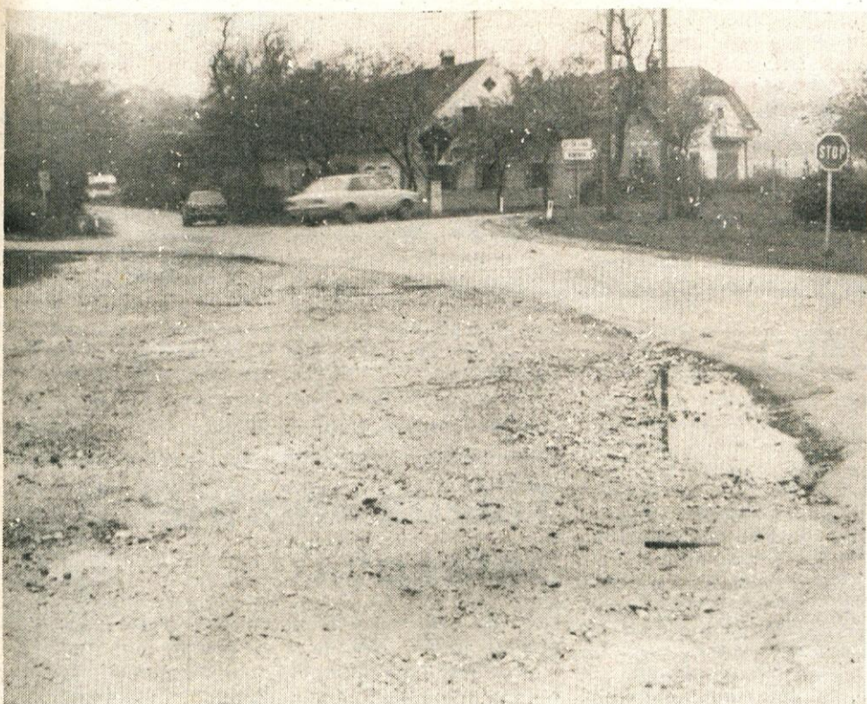
Tudi križišče v Mostah bo kmalu urejeno. Križišče Brniške ceste in regionalne ceste v Mostah, ki povezuje Škofjo Loko s Kamnikom, je že dolgo kamen spotike. Cestišče je zelo ozko in na kamniški strani pri gostilni Kralj polno lukenj, kar je ob deževnem vremenu za pešce zelo neprijetno. Toda to se bo kmalo spremenilo na bolje. Načrt ureditve križišča je sprejet in izdana so že tudi vsa dovoljenja in soglasja. Sedaj čakajo le še izvajalce del, ki so trenutno močno zaposleni na drugih deloviščih. Pričakujemo lahko, da bodo težki gradbeni stroji še letos začeli z delom, tako da bo križišče kmalu primerno urejeno in razširjeno, kar bo vplivalo na boljše počutje in večjo varnost vseh udeležencev prometa.