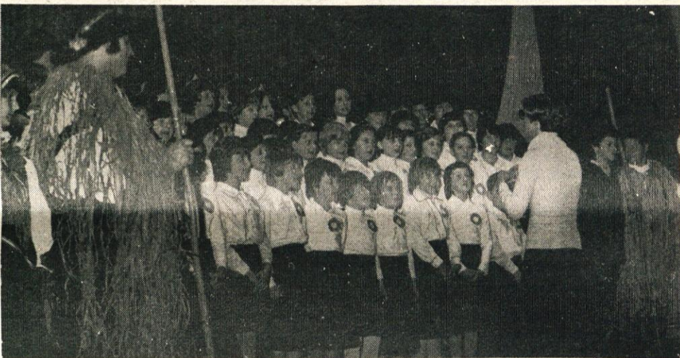
Na svečani akademiji v počastitev 85-letnice Planinskega društva Kamnik je v krajšem kulturnem programu nastopil poleg »Lire« in dijakov Gimnazije, tudi pionirski mešani pevski zbor iz osnovne šole Stranje. Mladi pevci, ki so bili oblečeni v enake bele bluze s planinskimi oznakami, so z živahnim petjem navdušili poslušalce in številne goste.

Naši gostitelji so nam še razkazali nekaj znamenitosti okoliških krajev ter vnanosti okoli Tržiča, ki so letos dobro obrodili. Po ogledu hriba Vrh, ki je izdolben, ker so v njem imeli vgrajene topove in skladišče municije, smo se poslovili od prijaznih gostiteljev z željo, da bi še vnaprej utrjevali prijateljstvo in stike z vsemi rojaki onkraj meje, kar jim bo pomagalo v boju za narodnostne pravice.