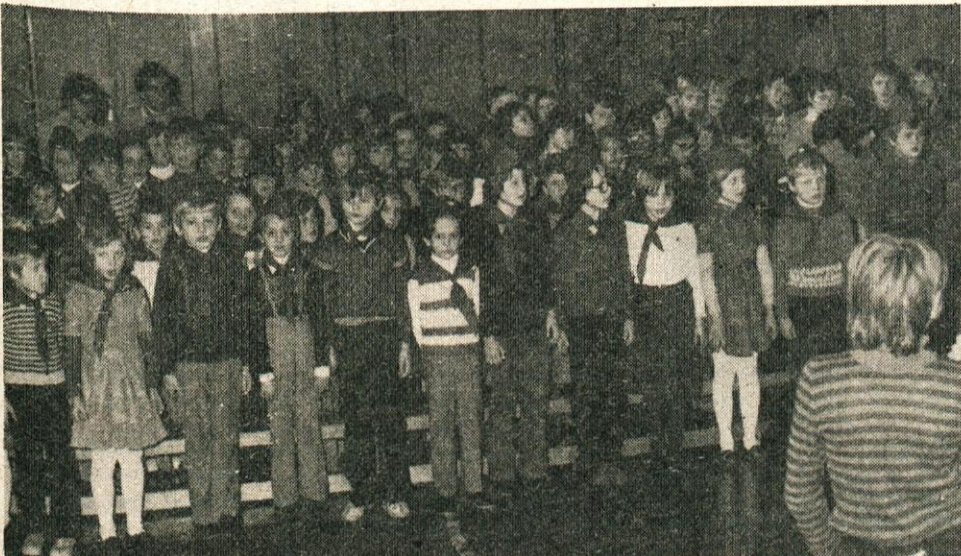
S sprejema cicibanov v Zvezo pionirjev