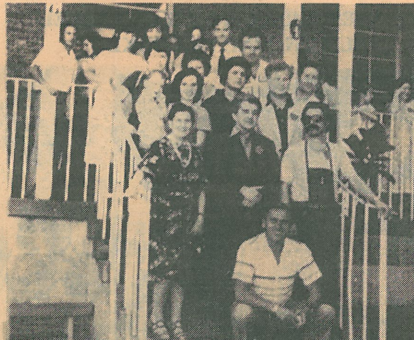
SNIMAK ZA USPOMENU: Nasi knjizevnici sa nastavnicama Etnicke skole.