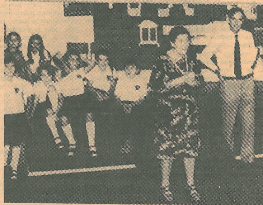
DESANKA MAKSIMOVIC, toplo kao sto samo ona ume, toplo i rodoljubivo kakva je i njena poezija, pozdravlja djake i roditelje.