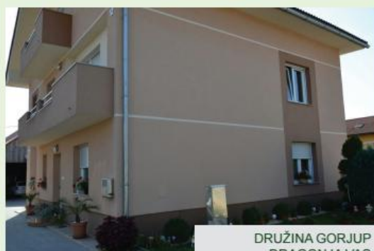
DRUŽINA GORJUP DRAGONJA VAS