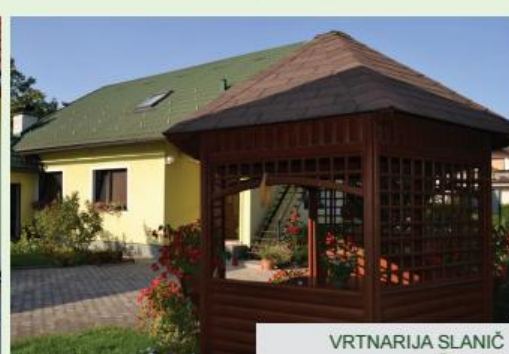
VRTNARIJA SLANIČ ŠIKOLE