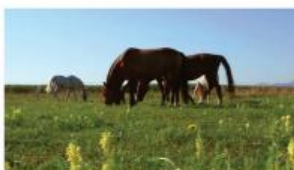
Predstavitve občine Kidričevo

Objavljamo seznam nekaterih prispevkov. Vabljeni, da si jih ogledate.