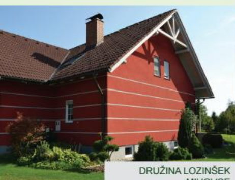
DRUŽINA LOZINŠEK MIHOVCE