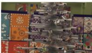
Božični koncert pevcev ...