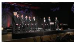
Letni koncert - Moški pevski zbor ...

Izdajatelj glasila: Občina Kidričevo, Kopalniška ulica 14, 2325 Kidričevo