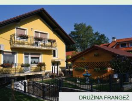
DRUŽINA FRANGEŽ STAROŠINCE