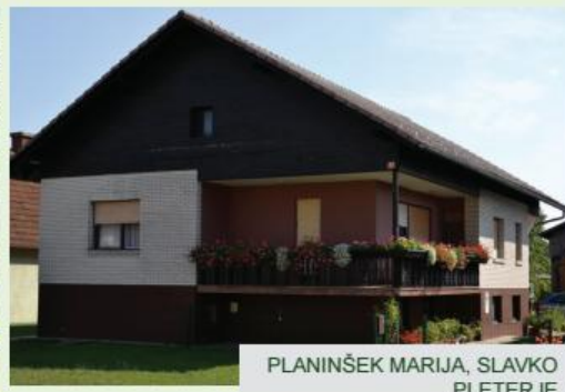
PLANINŠEK MARIJA, SLAVKO PLETERJE