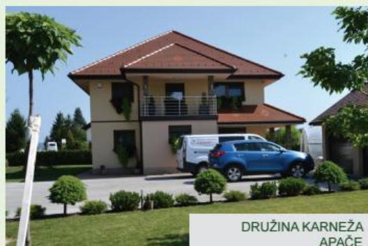
DRUŽINA KARNEŽA APAČE