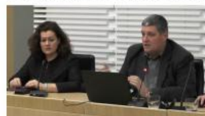
25. Redna seja občinskega sveta ...