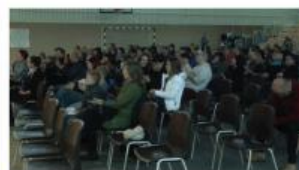
Pokaži kaj znaš OŠ Cirkovce | 2018