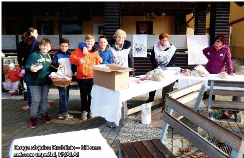
Druga stojnica Drobtinice – bili smo zelooooo uspešni, HVALA!

starejših krajanov na pogostitvi v decembru na povabilo g. župana. Obiskali smo naše vaščane v domovih upokojencev in na domovih ob jubilejnih praznikih, za božično-novoletne praznike pa vse bolne in težje pokretne krajanje. Še vedno se spominimo vseh, ki so starejši od 75 let, in jim pošljemo voščilnico. Sodelujemo z vsemi društvi in ustanovami v naši občini. Radi bi bili bližje ljudem – da bi bolj pomagali – zato potrebujemo srčne ljudi, take, ki opazijo stisko posameznikov, ki ne obsojajo, ne gojijo zamer, se razdajajo, znajo prisluhniti sočloveku in njegovim težavam ter o tem razpravljajo, se dogovarjajo in iščejo rešitve ne le na srečanjih na nivoju organizacije. Sedanji člani odbora smo v večini kar v letih, smo pa še vedno pripravljeni pomagati. Veseli pa bi bili