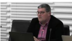
24. Redna seja obč. sveta ... | 1. del