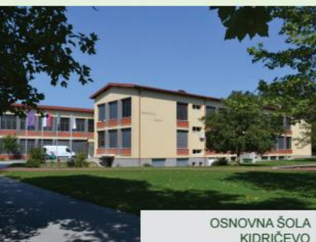
OSNOVNA ŠOLA KIDRIČEVO