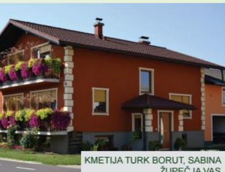
KMETIJA TURK BORUT, SABINA ŽUPEČJA VAS