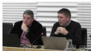
24. Redna seja obč. sveta ... | 2. del