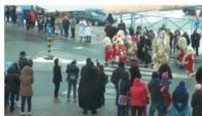
26. Cirkovski fašenk | 2018