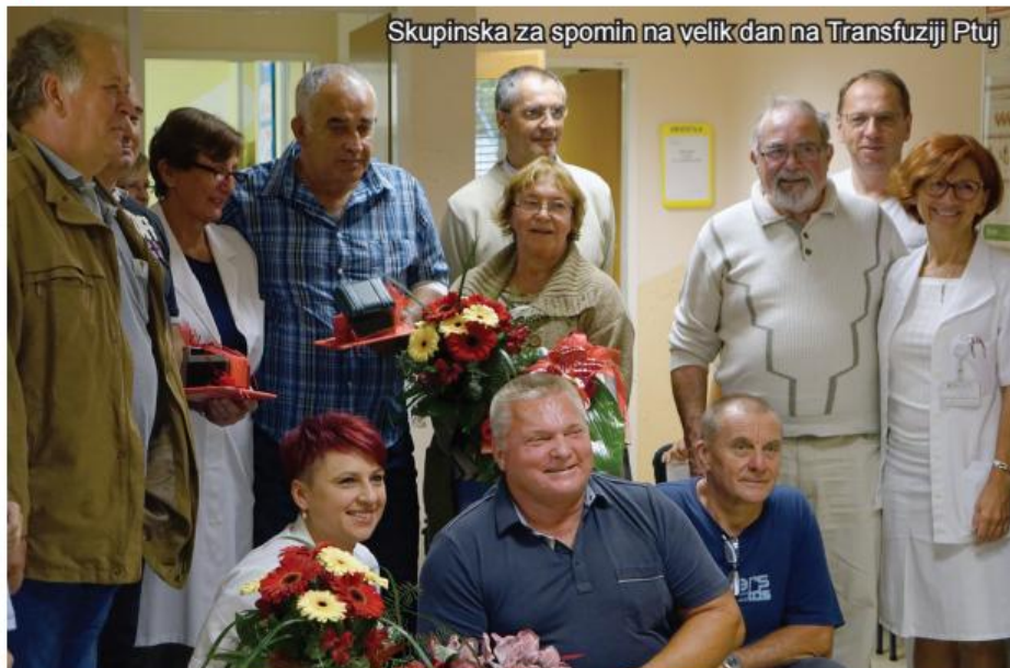
Skupinska za spomin na velik dan na Transfuziji Ptuj

Vsakemu vitezu namenimo nekaj besed, da ga tudi širše spoznajo. Tako bi tudi tokrat povedal nekaj stavkov o zadnjih treh vitejih.