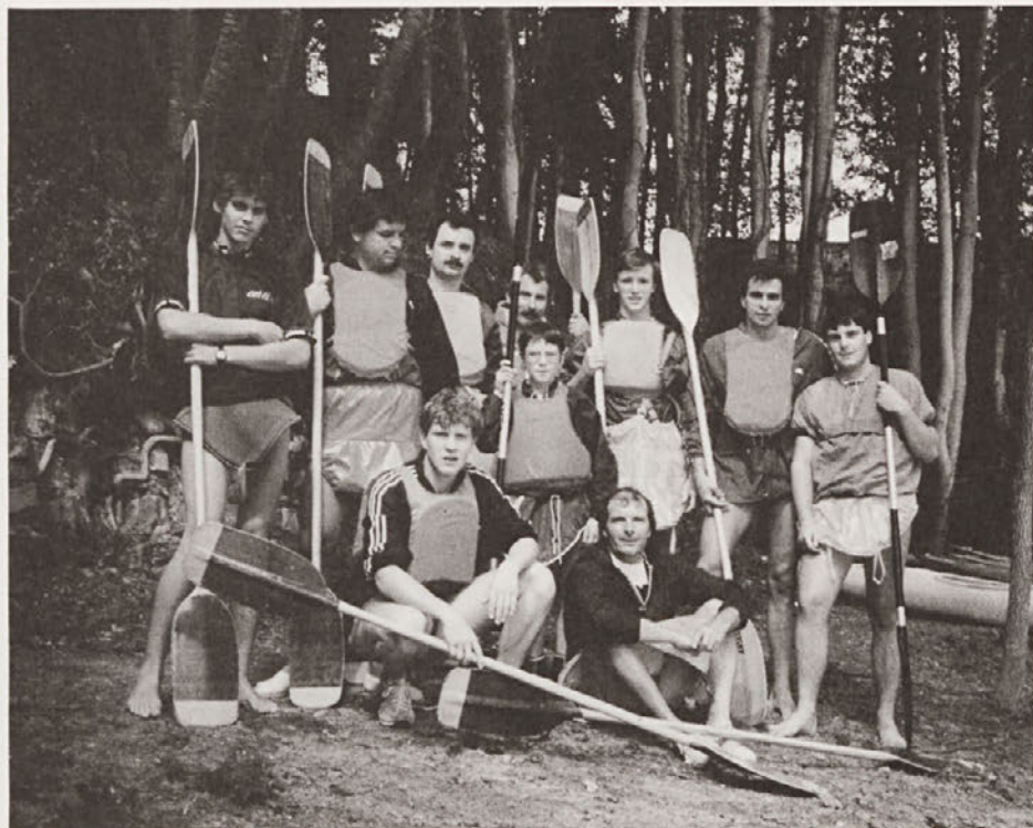
Kajakaški tečaj 1988, Soča obala po Permo

krvoločni, saj po tisoč petsto letih še nosimo v sebi prvotno domovino.